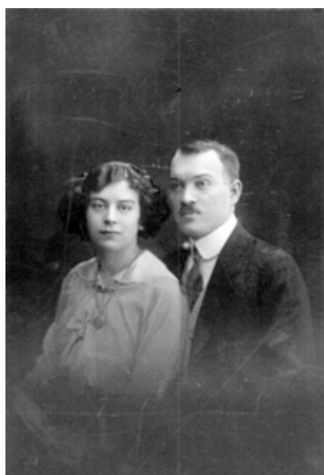
A fiatal házaspár (1914)

Egy másik versében, amely egy évvel korábban keletkezett, a szentgotthárdi kisdíák is feltűnik, amikor a városban járva belesett egy kerítés mögé. 3