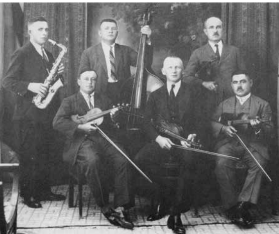
A híres, kőművesekből álló bátaszéki vonózenekar Ankarában, 1929-ben

Az egylet vezényleti nyelve a német nyelv volt (pl. a Kompanie marsch! [Csapat indulj!], a Kompanie halt! [Csapat állj!], a Habt acht! [Vigyázz!], a Schultert! [Igazodj!], a Laden! [Fegyvert tölts!] és a Feuer! [Tűz!] voltak az alapvezényszavak).