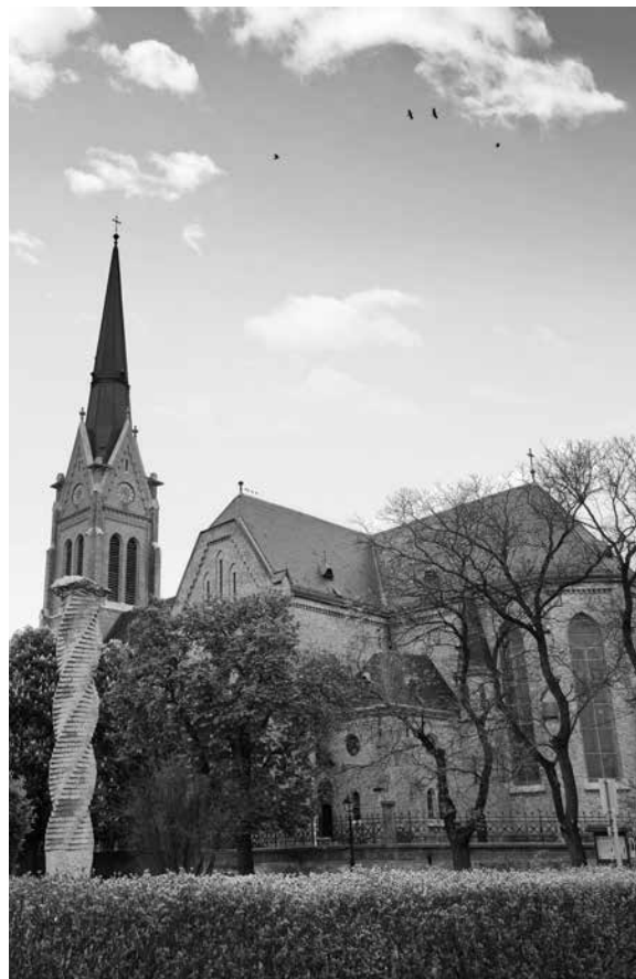
A bátaszéki templom

b) Társasági és kulturális egyesületek (pl. Polgári és Kisgazda Népkör , Bátaszéki Polgári Kaszinó , Bátaszéki Iparos Olvasókör , Olvasókör , Bátaszéki Katolikus Ifjúsági Önképzőkör ). Olvasókörök majdnem minden településen működtek abban az időben. Könyvtárakat hoztak létre. Ippal, mezőgazdasággal, általános műveltséggel kapcsolatos ismereteket terjesztettek. A szabadidő hasznos eltöltésének és a társasági életnek a színterei voltak. Nők is lehettek tagjai.