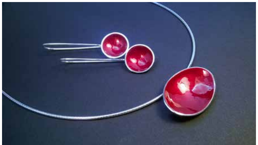
Vörös ellipszis függő és fülbevaló (Sterling ezüst, lakk, vörös pigment)