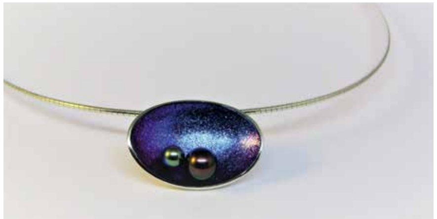
Privát galaxis függő (Sterling ezüst, japán zöld Akoya gyöngy, peacock aubergine édesvízi gyöngy, lakk, pigment)