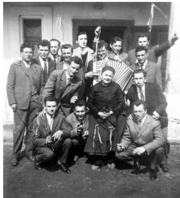
Húsvéti sibalók az 1960-as évek első felében. Tárnok.

dr. Székely András Bertalan sorozatszerkesztő