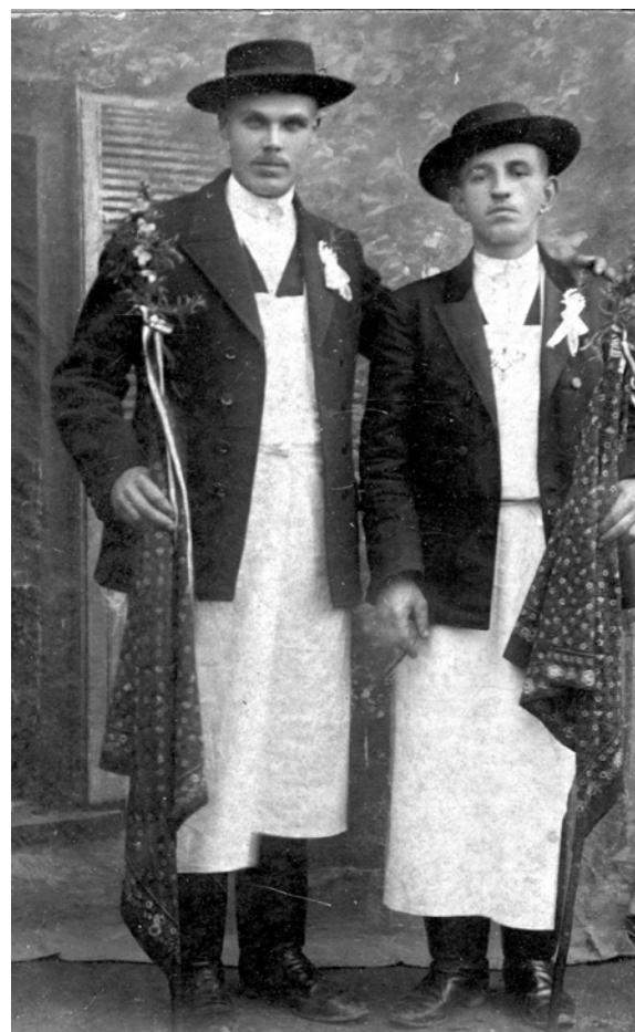
A vőfélybotokat az 1950-es években még képfestő kendővel díszítették. Tatabánya-Bánhida. A képet restaurálta: Dallos István fotóművész.