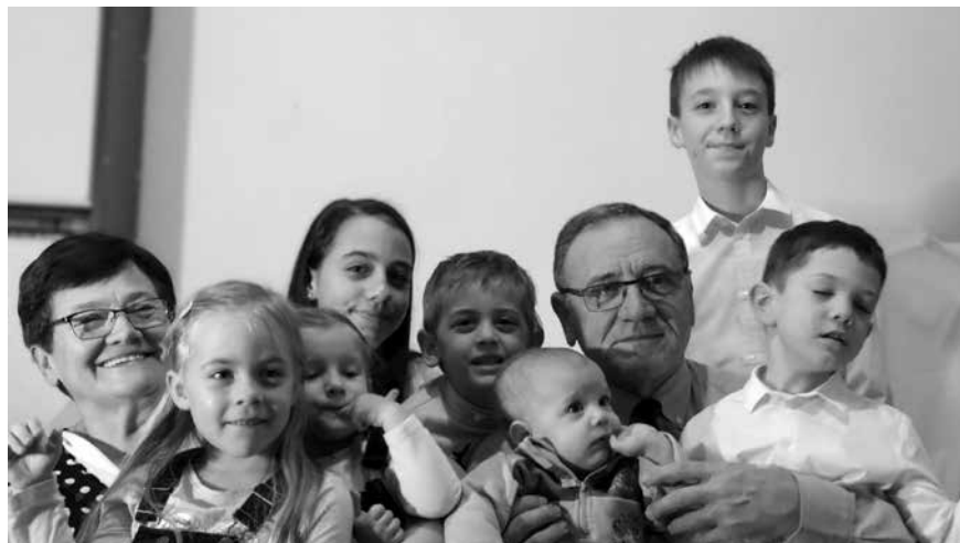
Az unokákkal 2019 karácsonyán