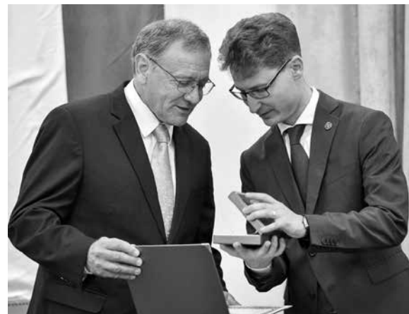
Fehérvár polgármesterével a Pro Civitate Díj átadásakor