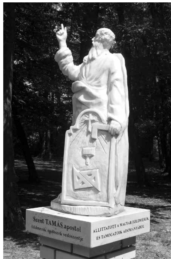
Szent Tamás szobra a Péruska Máriánál