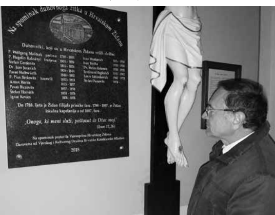
A zsidányi templomban