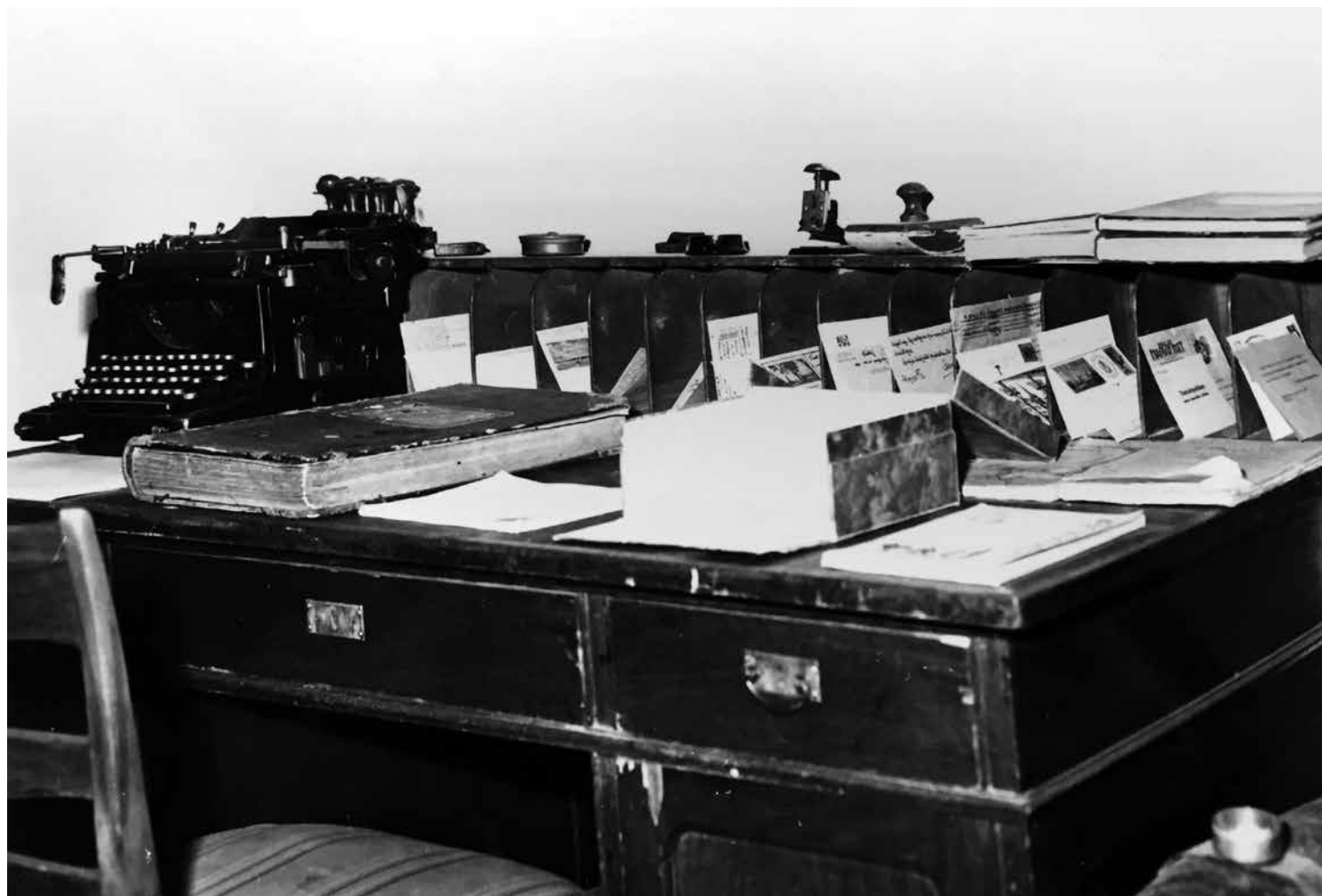
Íróasztalának rekonstrukciója a Savaria Múzeum kiállításán 1986-ban