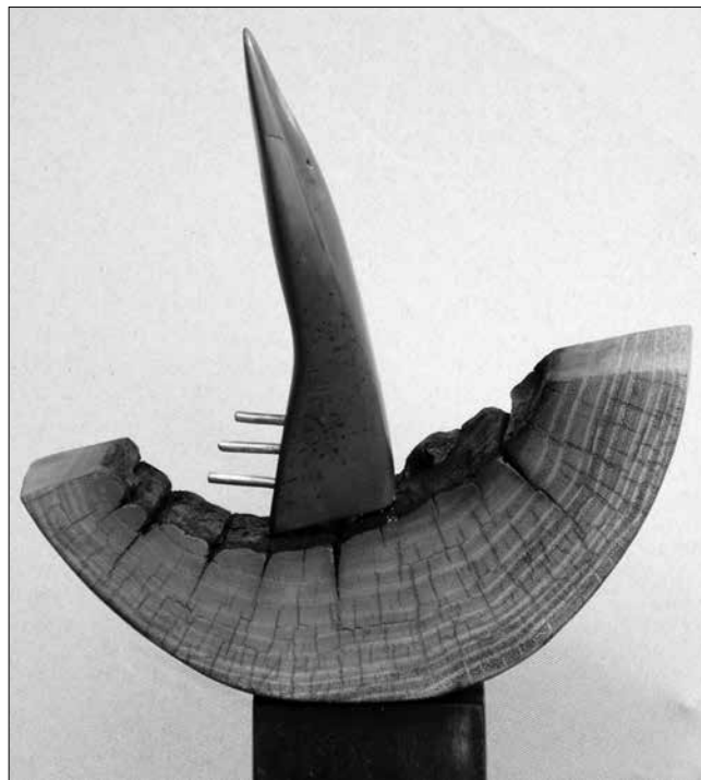
A csend magánya

Az én székelly mivoltom az én identitásom. Az erdélyi székelységemből, a fenyők ősiségéből, a mondák, a regék, a mitológia álomvilága vezet szobrainban és rajzaimban, festményeimben. A művésztelepen készült munka (A csend magánya) is ezt a székelly mivoltomat idézi. Isten tenyerében hordoz. Mitikus lényeim hol szárnyalnak, hol meg utaznak, megmutatva egy régen letűnt korszakot, az őslények világát. Mitikus állatom a szarvas. Fontos számomra a csodaszarvas, mely alkotásaim visszatérő motívuma is egyben, néha nagyon stilizálva, de mindig jelen van.