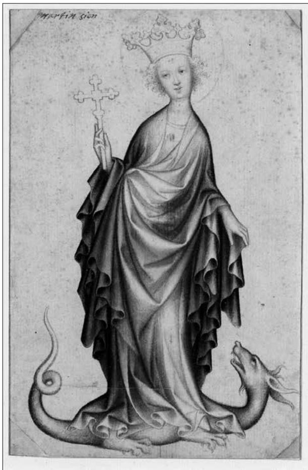
Cseh művész: Szent Margit (1410-15 k.)