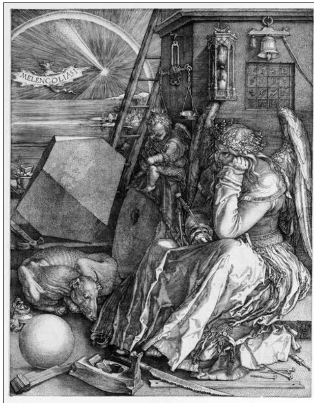
Albrecht Dürer: Melankólia I. (1514)