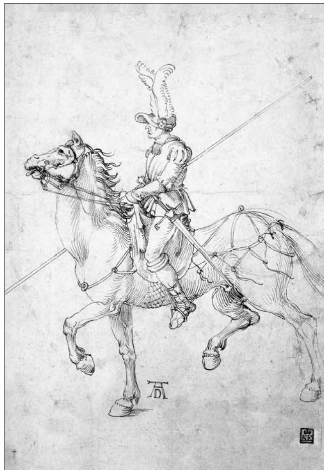
Albrecht Dürer műhelye: Lándzsás lovas (1502)