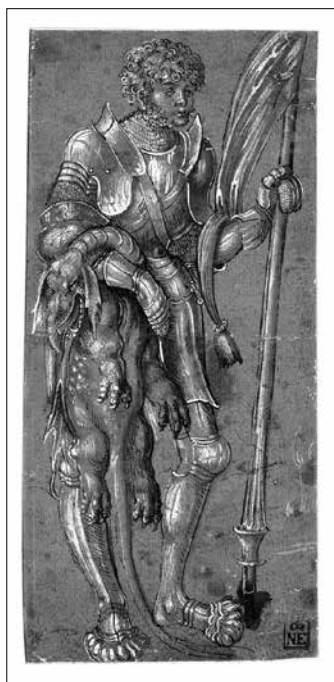
Id. Lucas Cranach: Szent György (1506 k.)