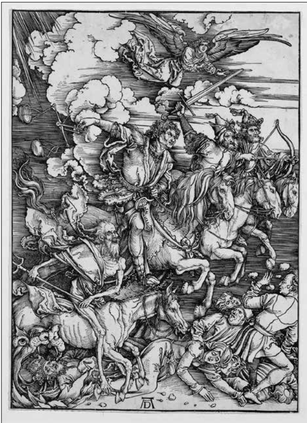
Albrecht Dürer: Az Apokalipszis négy lovasa (1497-98 k.)

áttekinthetőség kedvéért az anyagot hat fejezetre osztották. A bevezetést „A kezdetek: a 15. századi rajzok” részlege jelenti, de kiemelt jelentőségű „Albrecht Dürer és köre” a XVI. század első évtizedeiből, illetve a „Művészet II. Rudolf prágai udvarában” nevezetű rész is, ami az 1600 táján ott működött német, ún. „rudolfinus” mesterek munkásságát idézi fel. E két fejezet között megismerkedhetünk még az olasz reneszánszból átvett kifejezéssel meghatározott „Chiaroscuro rajzokkal”, melyek finom vonalkázásukkal szinte festői fény-árnyék átmeneteket mutatnak. Ezután „Az önálló tájbrázolás kezdetei és a fiktív táj” képei következnek. Az „Előkészítő rajzok”, a rendszerint olajjal vászonra festett, nagyszabású képek első, tollal, ceruzával vagy ecsettel papírra vetett ötleteit, kompozicionális kidolgozásait és pontos részleteit mutatja be. Ezek révén az alkotók féltve őrzött műhelytitkaiba is bepillantunk. Talán az eddigi felsorolásból kiderül, hogy jó néhány munka egyszerre akár több, más kategóriában is szerepelhetett volna, mint ahová jelenleg besorolták, de ezt a tetszés szerinti „helyreigazítást” akár fejben is elvégezheti az alapos szemlélő.