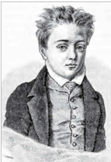
Gustave Flaubert 9 évesen