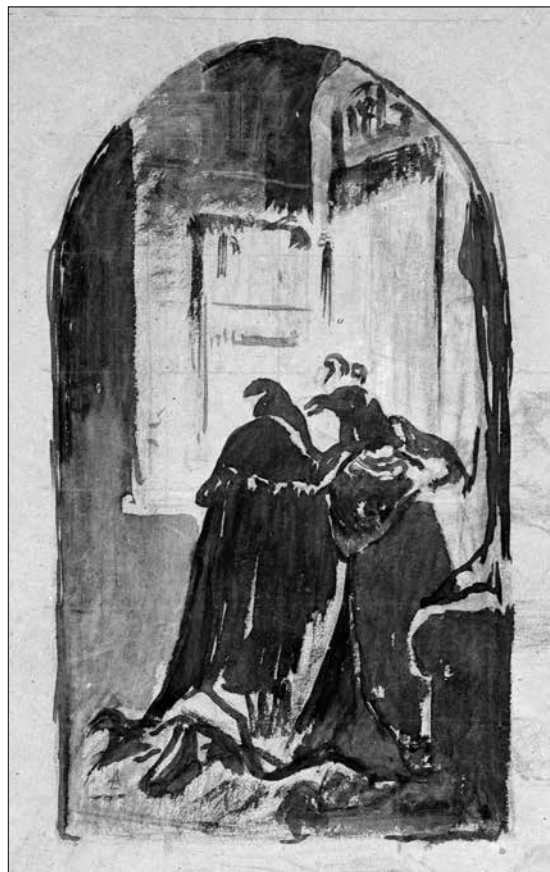
Liezen-Mayer Sándor: Faust és Mefisztó a párbaj után

1870-es évek első fele, tus, toll, ecset papíron