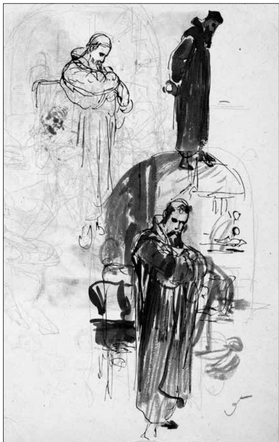
Liezen-Mayer Sándor: Faust a dolgozószobájában

Honi megrendelésre készült Magyarországi Szent Erzsébet (1882) című festménye jelenleg a Budavári Palotában székelő Magyar Nemzeti Galéria első emeleti, a XIX. századi festészet részlegén látható. Ugyanitt, a grafikai kabinetben gyönyörködhetünk abban a kamaratárlatban, amely az „Azzal vagy egy, kit megragadsz” címet kapta. Ezt a festő Faust-illusztrációból rendezett összeállítást Hessky Orsolya művészettörténész jegyzi, aki példás gondossággal válogatott idézeteket is a képeket kísérő háttérinformációk mellé. Az intézmény grafikai gyűjteményében fellelhető előtanulmányokat és a művész vázlatkönyvéből kiragadott – a legkülönbélebb technikákkal készített: a ceruzavonásoktól a tusba mártott tollon és ecseten át a lavírozott festményekig sok