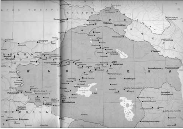
Arménia és a kereskedőutak

tő programot folytatta az ifjútörök kormány is, mely 1915-től végrehajtotta a XX. század első népirtását. Ennek másfél millió polgári lakos esett áldozatul, félmillió pedig más országokban keresett és talált menedéket.