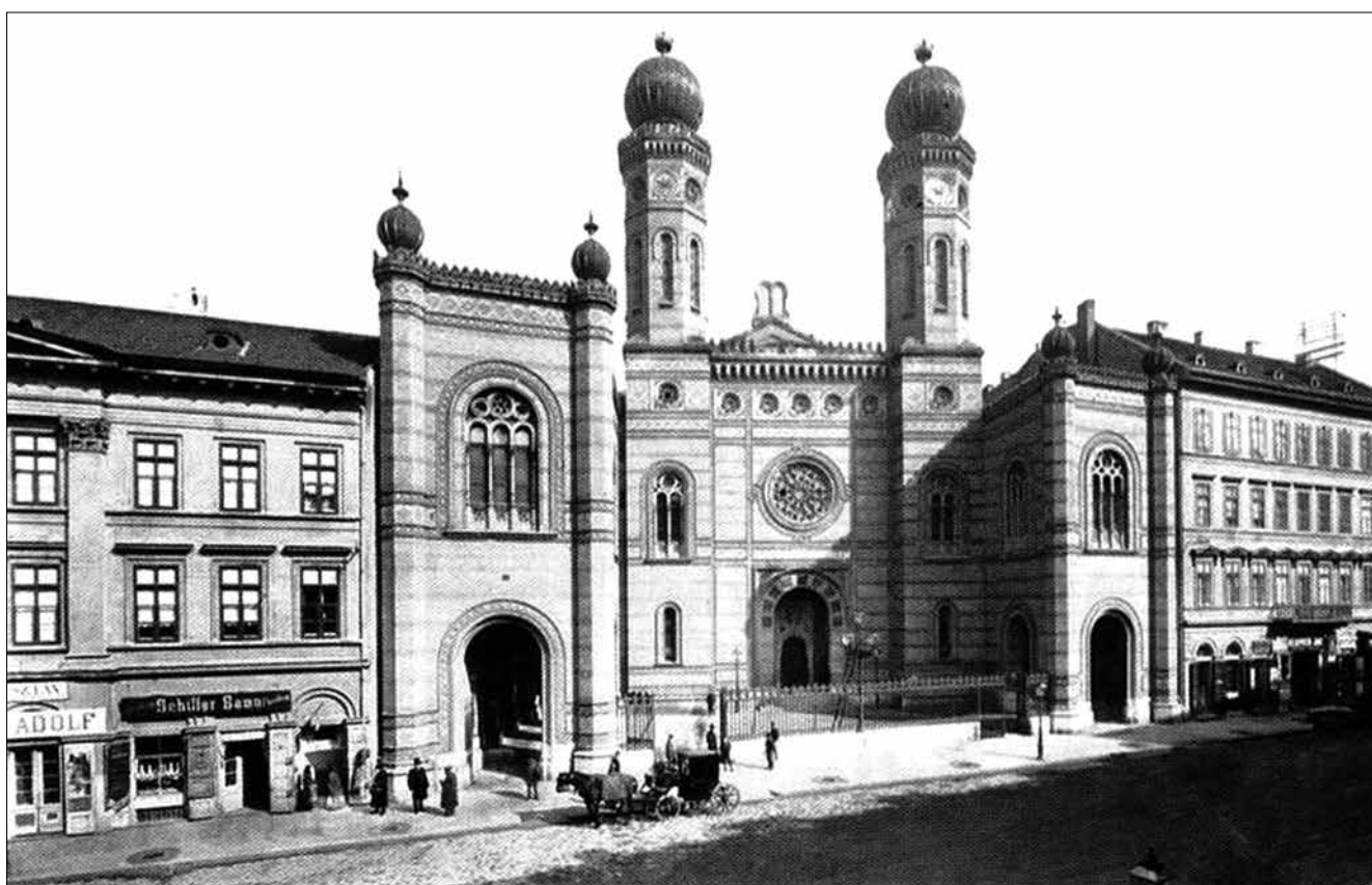
A Dohány utcai zsinagóga 1890 körül (Budapest Anno, Corvina, Budapest, 1996, 91. kép.)

A Pesti Izraelita Hitközség 1841-ben szerezte meg a Síp utcai telket, majd a Dohány utcaig nyúló rész is birtokába került. Mindez a régóta tervezett önálló zsinagóga felépítését célozta, hiszen a különböző épületekben – köztük a Károly körüti Orczy-házban, a Király utcai „Fehér lúd” házban – működő imatermek széttagolták a közösséget. Az építkezés