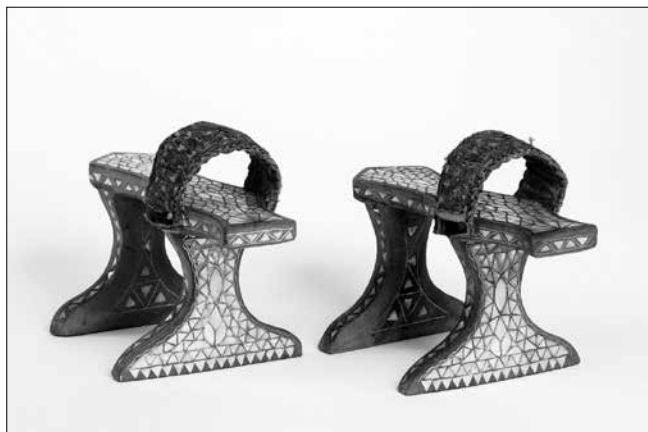
Szíriai kabkab, berakásos női fapapucs (19. század)