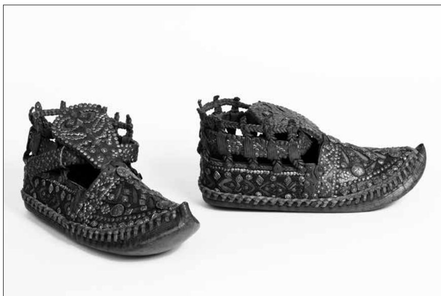
Bosnyák férfi bocskor (20. század első fele)

A bocskoros részleg nyitányaként kiderül, hogy a Balkánon nem ismerték a cserzést, ezért az állatbőrt szőrös külső felével használták fel a lábbeli készítéséhez. Ekképp született meg a máig élő „szőrös talpú román” becsmélő minősítés. Köllő Rezső 1912-es jelenetén székely bocskorosok szűrik a tejet a Gyimesben (ma Ghimeș, Románia). Háti tömlőben szállít ivóvizet a Póla vidéki nő Dalmáciában Tasnádi Kubacska András 1937 előtti fotóján, az 1940-es években Körösmezőn (ma Jaszinya, Ukrajna) készült képén viszont a férfiak – valószínűleg a munkakeresés okán, a városba járás miatt –, már bakancsot viselnek, az otthon maradt nők