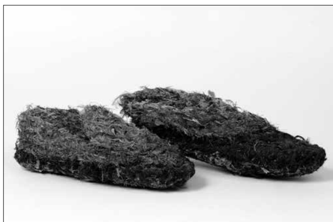
Ausztrál kurdaicsa, vérbosszú cipő (20. század első harmada)