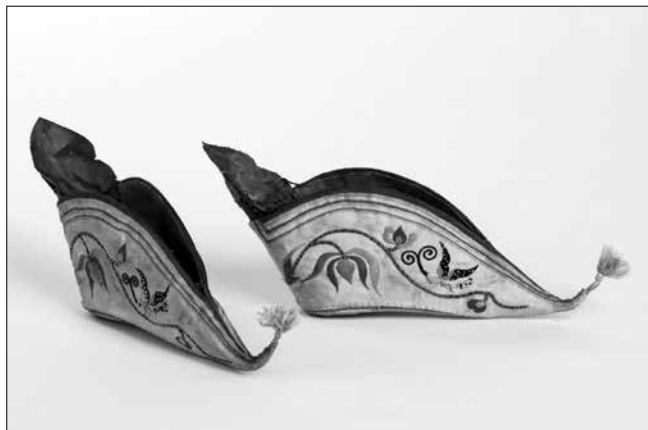
Kínai női lótuszcipellő (19. század második fele)