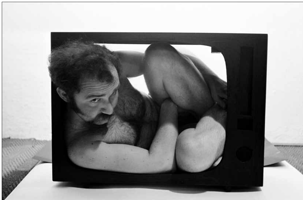
Halász Károly: Privát adás II. (1974) a Paksi Képtár gyűjteményéből