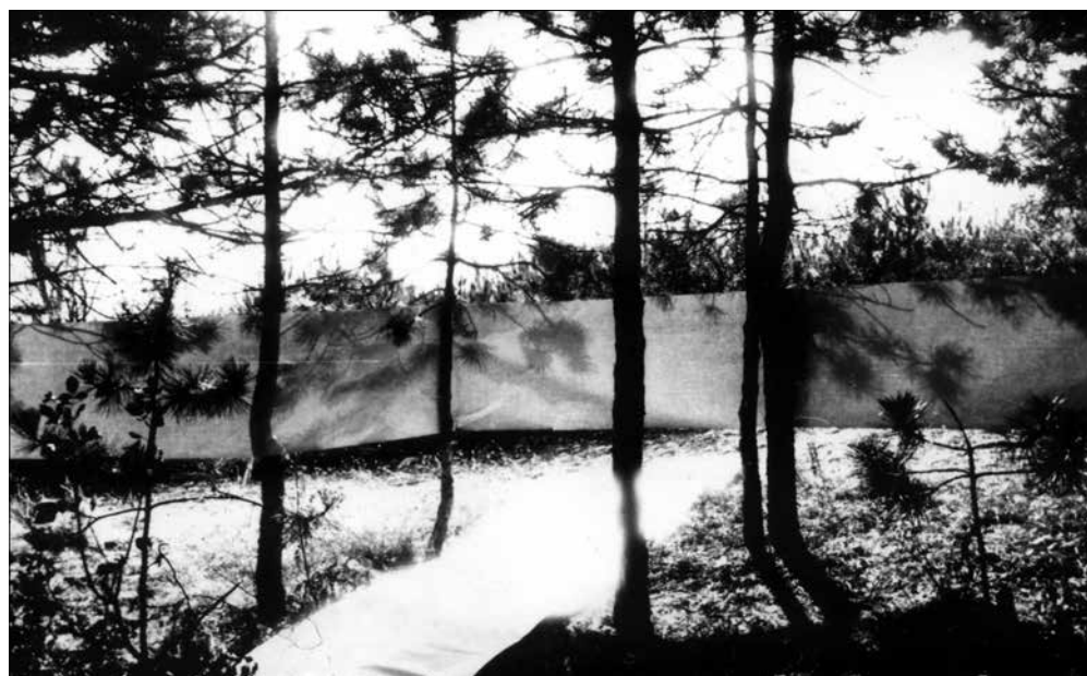
Pécsi Műhely: Világoskék papírtekercs a fák között kifeszülve (1970. nov. 15.) a Paksi Képtár gyűjteményéből

Akár a Hamvadó cigarettavég, a második világháború idején örökzölddé lett sláger is eszünkbe juthat Szijártó Kálmán Art gesztusok (1974) fényképsorozatáról, amely az elégsé fokozatait, egymást követő szakaszait rögzítette (a kiállításra a horvát kortárs, Marinko Sudac európai hírű és rangú zágrábi magángyűjteményéből érkezett). És még hosszasan folytathatnánk a tallózást.