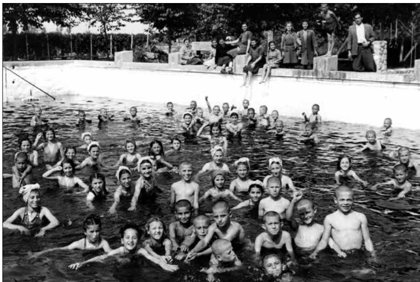
Gondos szemek figyelik a fürdőző görög gyermekeket a tótkomlósi strandon

A tótkomlósi nyaralásra érkezett görög gyerekek csoportja a magyar iskola udvarán 1949 májusában