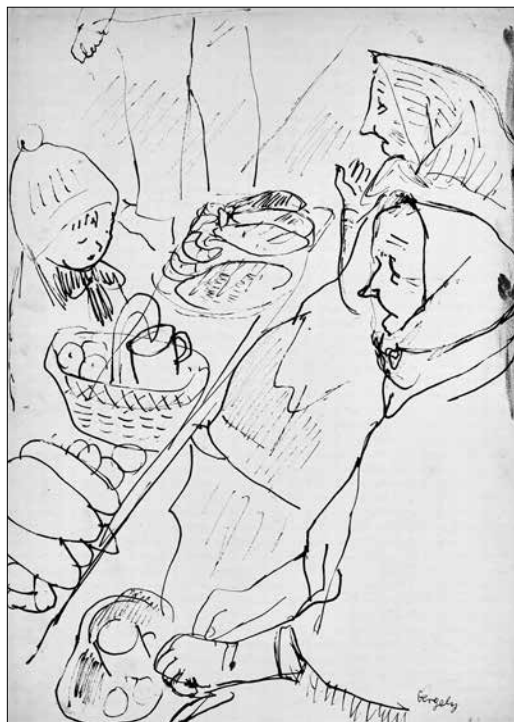
Gergely Tibor: A bécsi Naschmarkt (1930) tollrajz