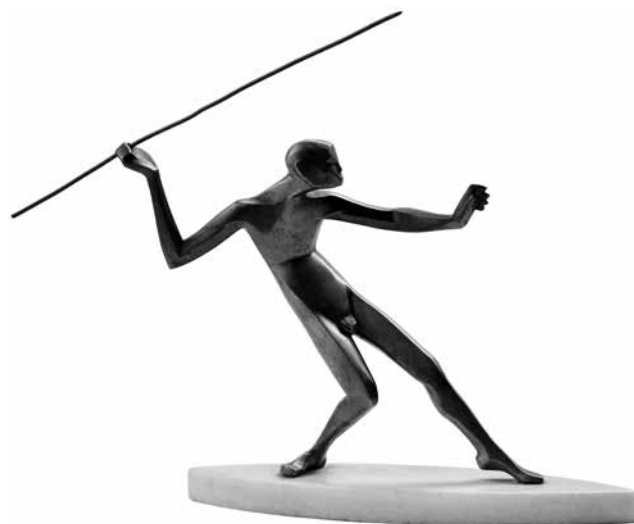
Kövesházi Kalmár Elza: Gerelyhajító (1920) bronz