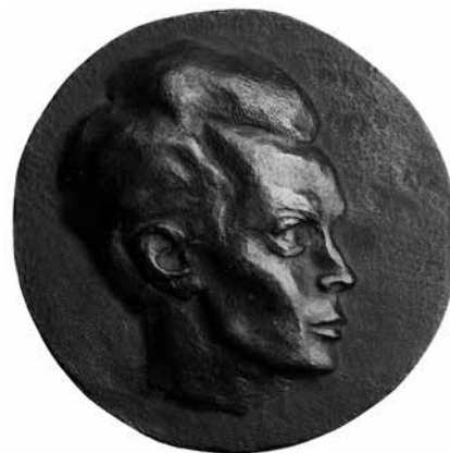
Ferenczy Béni: Schiele halála 10. jubileumára (1928) bronzérem