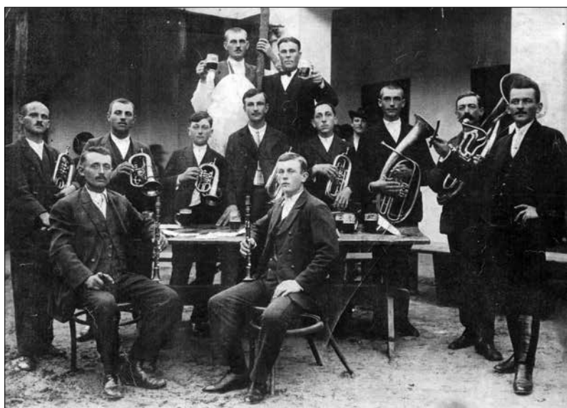
A híres Bimüller zenekar