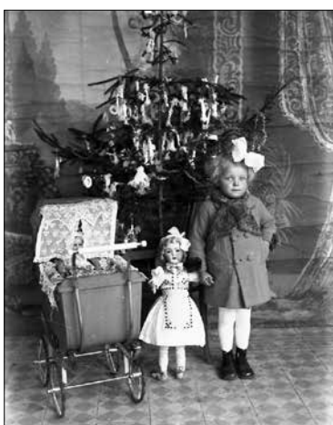
Gazdag karácsonyi ajándék: babakocsi egy tehén áráért