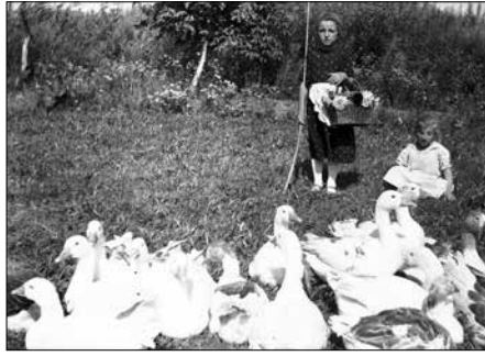
A gyerekek kis koruktól részt vettek a családi munkákban. A fotón libákat őriznek

Az 1947. augusztus 31-én éjszaka Dunaföldvára szökött németkéri férfiak és fiúk csoportja. A felvételt a szintén oda menekült Molnár József készítette a dunaföldvári nagytemplom mellett.