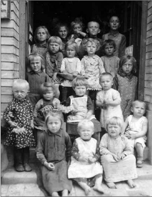
Környékbeli gyerekek a Molnár bolt ajtajában