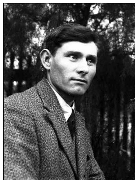
A fotográfus Molnár József