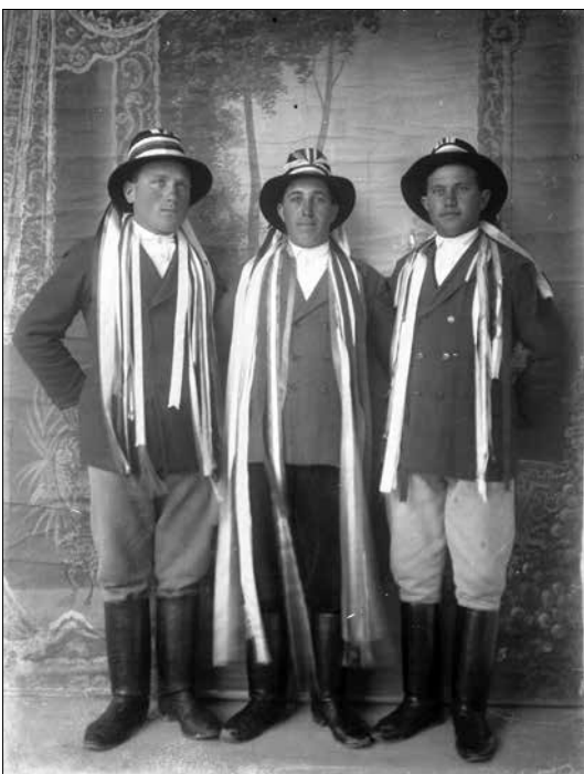
A rekruták voltak a legények lelegeje...