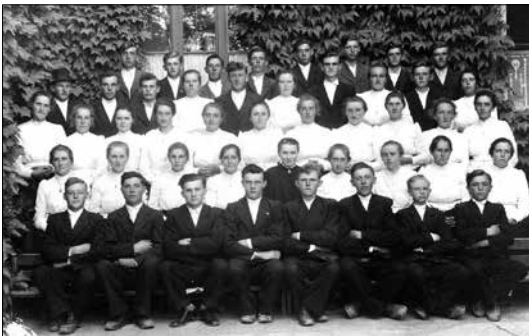
A képen az 1924-ben születettek láthatók 1940-ben. Egyik osztálytársuk temetése után fényképeztették le magukat az iskola udvarán.