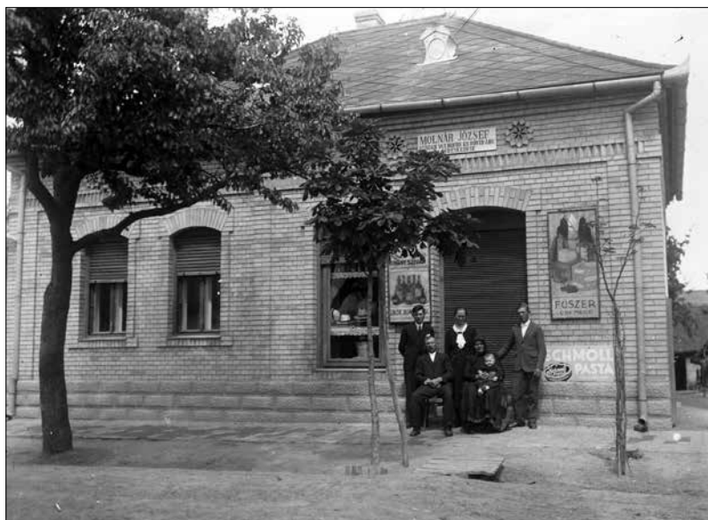
A Molnár család háza és üzlete