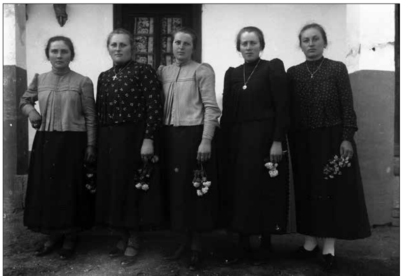
Barátnők ünnepi viseletben