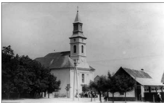
A felvétel a 30-as években készült, amikor a templom tetejét újrafedték palával.