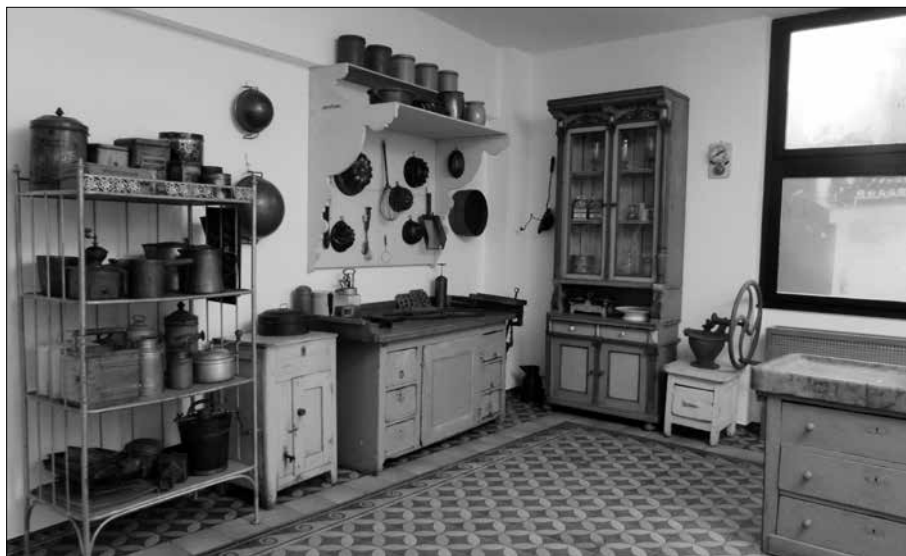
Városi kamra különféle háztartási felszerelésekkel

A fürdőélet aranykora az Osztrák-Magyar Monarchia öt évtizede volt, a kiegyezéstől az első világhévig. Akkoriban országszerte 286 gyógyforrást tartottak nyilván. A ráérősen „boldog békeidőkben” a kezelés egy hónapon át tartott, s az ivókúrákon, diétákon és tornán túl a szellemi felfrissülést segítő társasági élet is hozzátartozott. Ez utóbbiba a népszerű térszene, a bálók, a színházi előadások és a komolyzenei hangversenyek is belefértek. Az egykori Nagy-Magyarország területén szétszórva, a Felvidéktől a Székelyföldön át a Bánságig a legnépszerűbb fürdőhelyek közé tartozott Pöstyén, Trenčsenteplíc, Bártfa, Szliács, Tusnád, Borszék, Buziás, Herkulesfürdő, Parád és Harkány. A trianoni döntéssel ezek javarésze a határokon kívülre került. Ekkor vált slágerré a „Szép vagy, gyönyörű vagy Magyarország” édesbús melódiája és „sírva vigadó” szövege – amelyet megállás nélkül hallhatunk a gramofonból. Az ekkortól „magyar tengernek” becézett Balaton mellett keresetté váltak a fővárosi gyógyfürdők (a törökkoriak után az újabb keletű, szecessziós