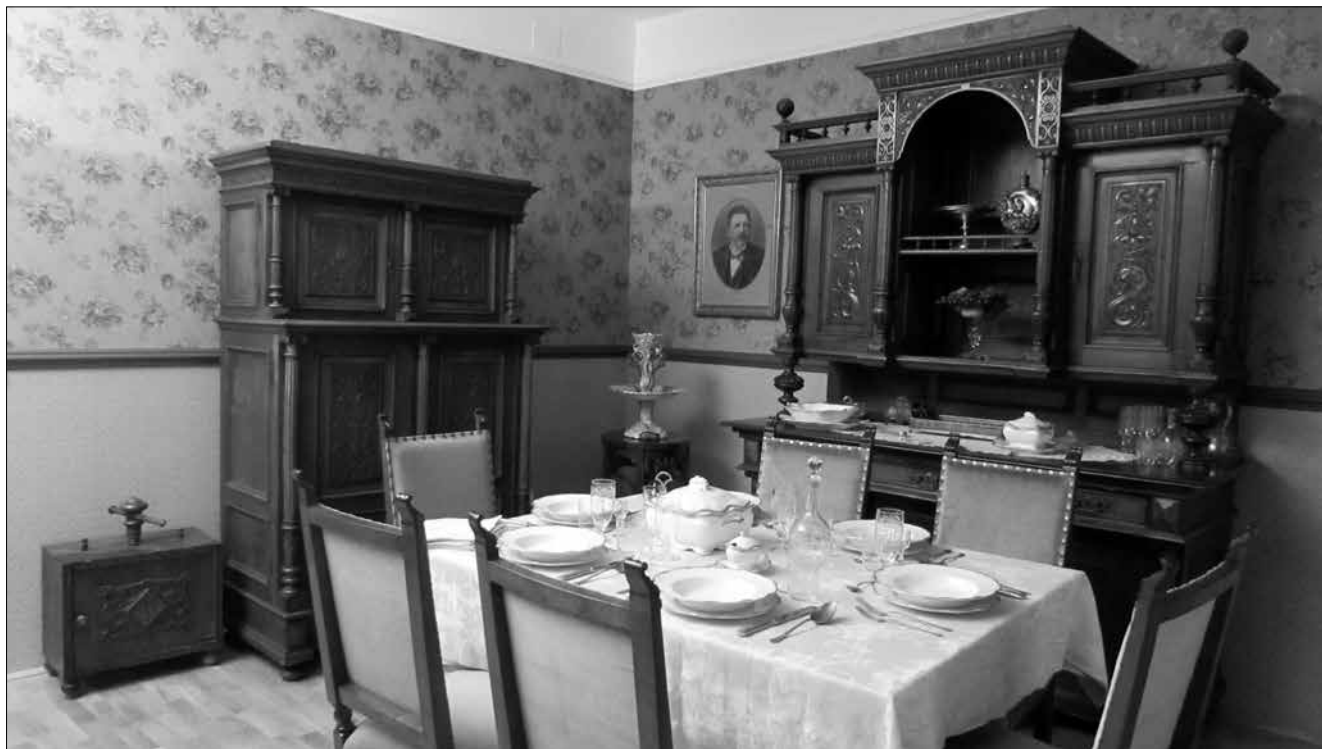
Középosztálybeli ebédlő ónémet bútorokkal