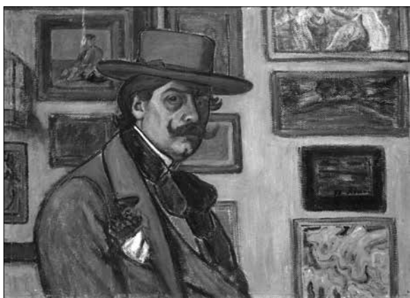
Rippl-Rónai József: Önarckép barna kalapban (1897, olaj, vászon)

A magyar és francia „privát szféra” néhai hangulatát idézi egy másik telitalálat, Rippl-Rónai: Önarckép barna kalapban (1897, olaj, vászon)