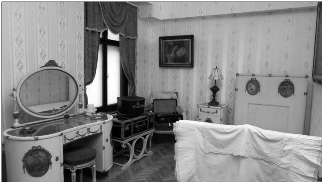
Elegáns szálloda női hálószobája