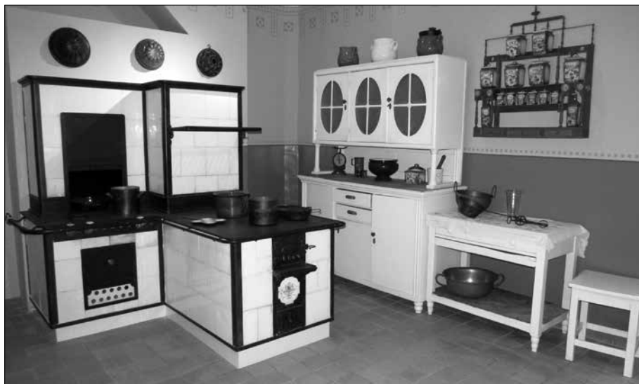
Monumentális tűzhely nagypolgári konyhában