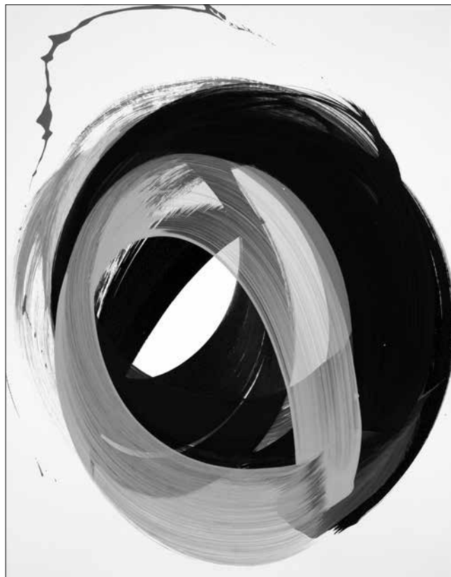
Nádler István: Nulla-ciklus No.1. (2014, akril, kazein-tempera, papír)