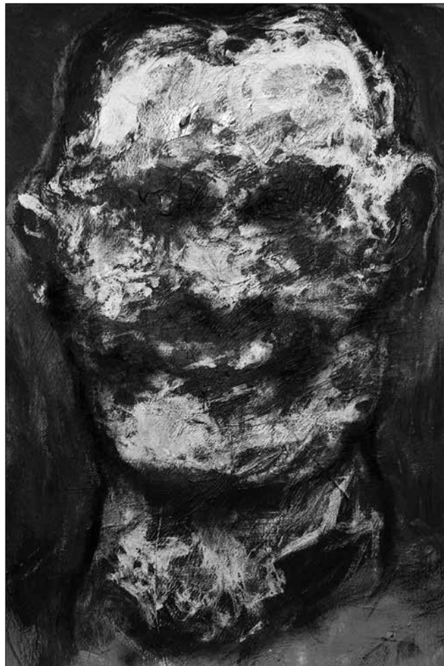
Gaál József: Fej I. (2014, vegyes technika, papír)