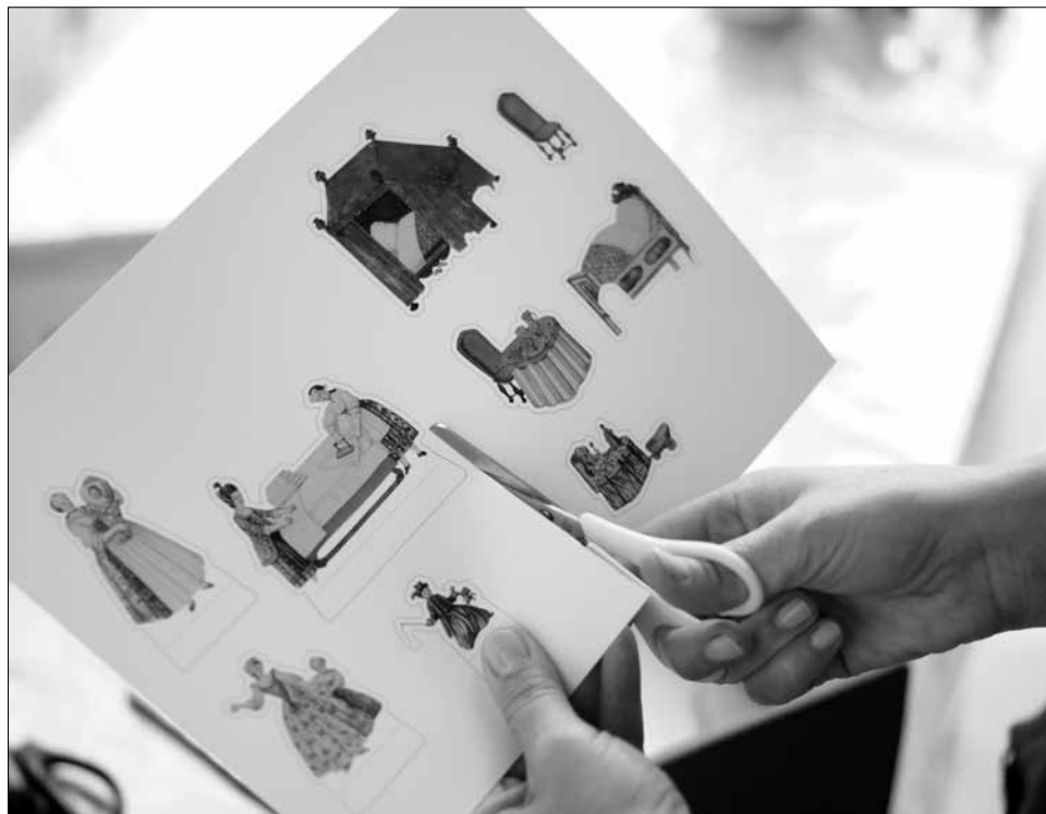
Képkivágás a kísérő gyermekprogramokon

többször koncertezett a városban, a helyi előkelőségek otthonában. A tágas főtéri lakás zeneterméről készült kép ezért is izgalmas. Abroncs-szoknyás hölgyek legyezik magukat rajta, tapsolnak vagy virágcsokrot nyújtanak át a rizsposros parókás muzsikusoknak. A fehér szalon falán tájképek és az elődök képmásai, a tálalón ezüst és fajansz díszedények, egy asztalkán madárkalitka áll. Az oldalajtón át a hálófülkébe látni, ahol a kitért, kétszárnyú ruhászekrény polcain glédában áll a frissen mosott-vasalt fehérnemű. Ezek a cselédszobában szorgoskodó, „pihenésként” rokkán fonogató vagy foltozó, varrogató szolgálók kezéből kerültek ki, miközben a nagypolgári család nőtagjai az ebédlőben a csemegékkal rakott asztal körül uzsonnáznak, vagy más szobákban hímeznek, harisnyát kötnek, csipkét vernek, avagy a társaságban táblajátékot játszanak. Az említett helyszíneken és jeleneteken túl, betekintést kaphatunk a vaslábasokkal, rézserpenyőkkel és óntálakkal alaposan felszerelt konyhába éppúgy, mint a halat, vadat, zöldséget, gyümölcsöt és egyéb élelmiszertartalekokat őrző kamrába, de kitekintést nyerünk a lépcsőházba is, a küszöbön fekvő ház-őrző kutyákra... Ezzel azonban korántsem teljes a felsorolás.