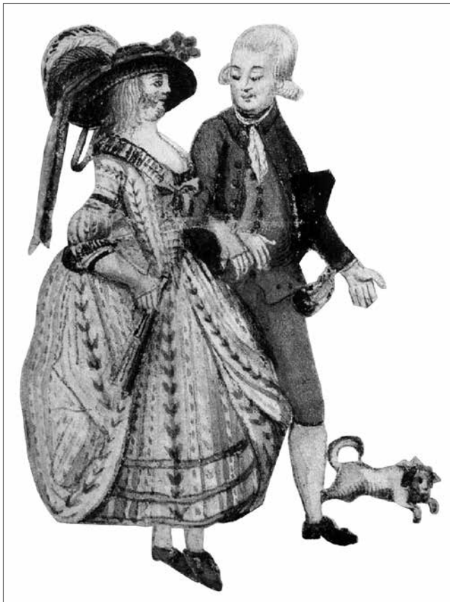
Elegáns sétáló pár kutyával a téren