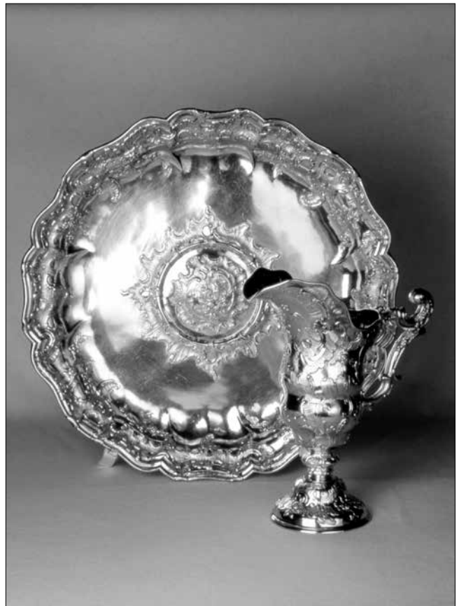
Augsburgi aranyozott ezüst mosdókészlet (1763/64)