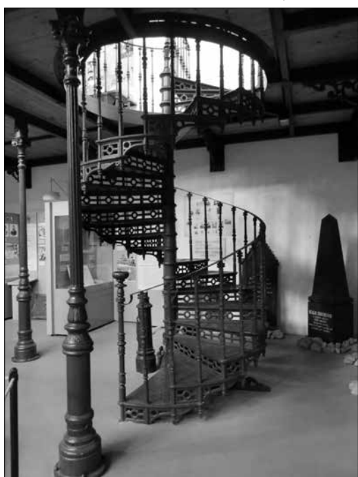
A Ganz-öntödében készült öntöttvas lépcső ma az Öntödei Múzeumban látható

Az átépített csarnok belülről. Jól látható az eredeti fa tetőszerkezet a sédtetővel. Ez utóbbi az ország első ilyen jellegű tetője volt.