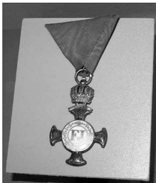
Ganz 1863-ban kapott Ferenc József Érdemrendet