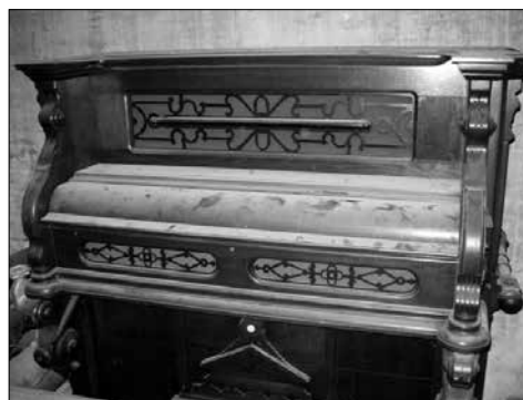
Szülőfaluja templomának adományozott harmónium