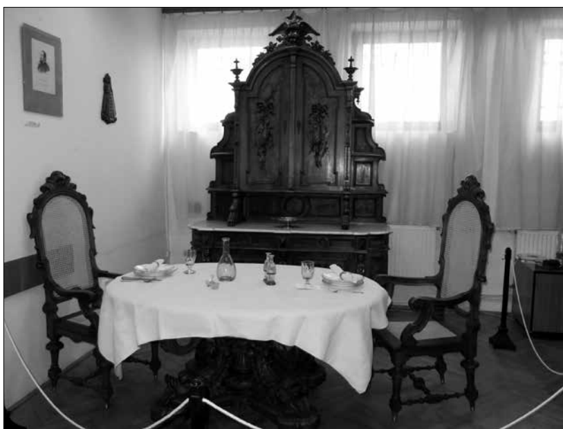
A Ganz palota egykori ebédlőjének eredeti bútorzata

1867. december 15-én a család éppen a Duna-parti palota díszes ebédlőjében tartózkodott, amikor Ganz hirtelen fölébredt, bement a betegen fekvő nevelt lányához, megsimogatta őt, s leugrott az első emeletről az udvarra. Azonnal szörnyethalt. Ötvenhárom