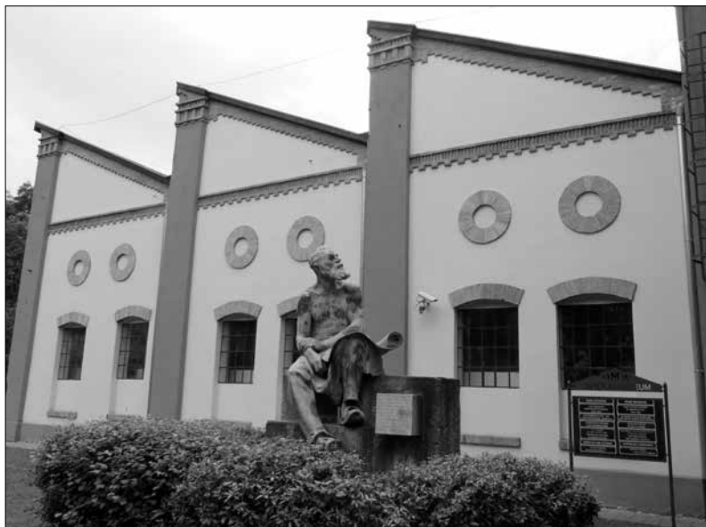
A Ganz által átépített csarnok, ma Öntödei Múzeum. Előtte az egykori Mechwart szobor egyik mellékalakja.

Az átépített csarnok belülről. Jól látható az eredeti fa tetőszerkezet a sédtetővel. Ez utóbbi az ország első ilyen jellegű tetője volt.