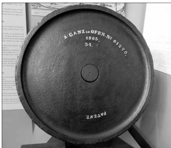
Ganz-szabadalom a kéregöntéssel készült vasúti kerék