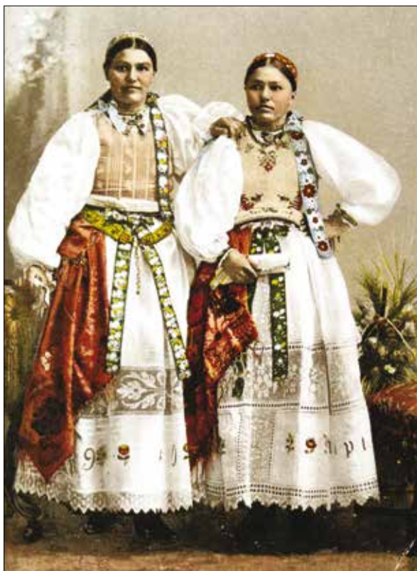
Szász leányok. A jobb oldali rátétes mellrevalóban, a bal oldali selyemmellesben, mindkettőjük recheímzéses köténnyel, amelyen a készítés ideje olvasható, 1908-as soproni bélyegzéssel