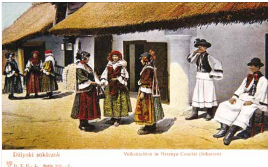
Dályoki sokácok D. T. C. L. Serie 301. - 2.