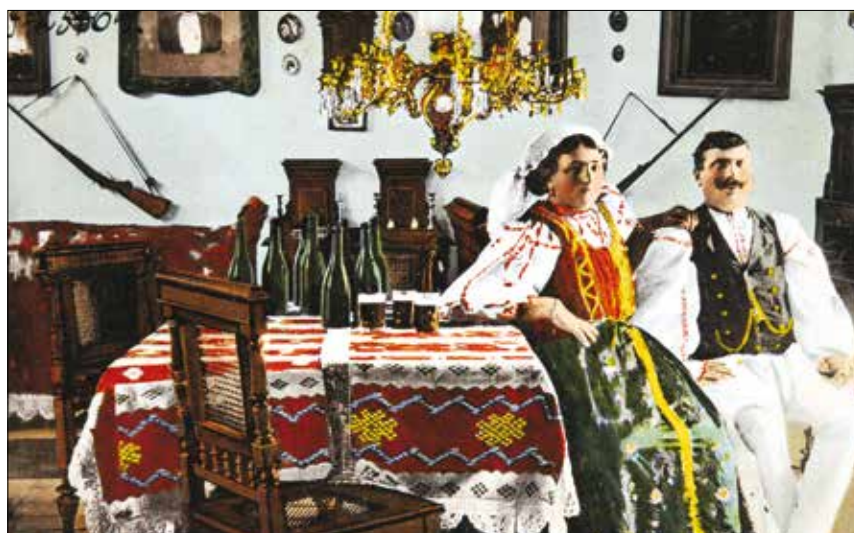
Hunyad megyei jómódú román gazda és felesége lakószobája. Divald és Monostory kiadása, 1912

Képeinket Tasnádi Zsuzsanna azonos című könyvéből válogattuk, mely a Cser Kiadó és a Néprajzi Múzeum gondozásában jelent meg 2013-ban, Budapesten.