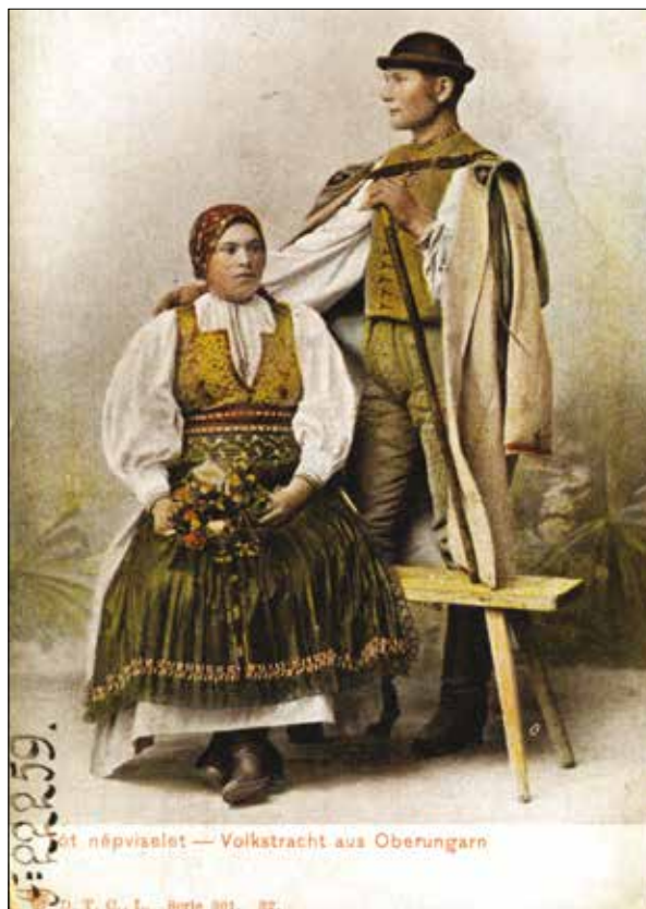
Fiatal szlovák pár viselete, Túrócszentmárton, Túróc megye, D. T. C. L. kiadása, 1905 után