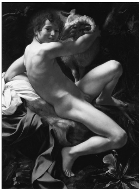
Caravaggio: Keresztelő Szent János (1602)

Giulio Cesare Procaccini A Szent Család (1618-1620 körül) olajjal festett falapján Mária egy patak partján épp járni tanítja gyermekét, aki jobbában a paradicsomi bűnbeesést jelképező almát tart. Szent József a háttérből figyel a kisfiú első lépéseit. Caravaggio és követői hatását mutatja Massimo Stanzione Mária a Gyermekkel című 1645 körüli vászna, ahol a gyer-