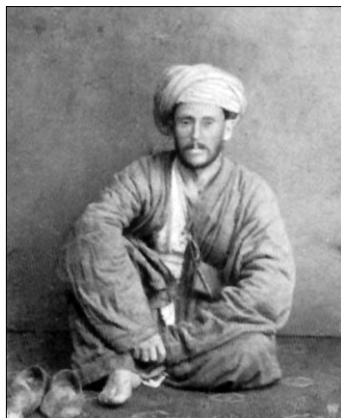
Vámbéry dervisruhában, 1864-ben, Londonba érkezése után készült felvétel

Vállalkozását ő maga is merésznek tartja: „talán vakmerő csíny volt ez, melynek veszedelmeire mind a mellett nem is gondoltam akkor!” Miért? Mi oka volt annak, hogy addig egyetlen európainak sem sikerült ép bőrrel megúsznia egy ilyen utazást? Mit tudott Európa az akkori Közép-Ázsiáról? Szinte semmit, hiszen európai, egészen Vámbéryig, élve nem tért onnét vissza. Akkoriban arra a területre, a Kaszpi-tengertől a Tien-San hegységig, Oroszország és Irán vetettek szemet, de az Afganisztánban tért nyert angolok is érdeklődve tekintettek abba az irányba. E területet a XIX. században három különböző, fanatikus, kegyetlen kánság tartotta ellenőrzés alatt nem riadván vissza az erőszak semmilyen formájától sem annak érdekében, hogy fennhatóságukat biztosítsák. A külvilággal nem érintkeztek, idegent nem engedtek maguk közé. Főként nem európaiakat, akiben egyből az orosz vagy angol kémek látták. Az ilyeneket a legkegyetlenebb módon ölték meg. Semmivel sem volt jobb a helyzet Türkménia sivatagaiban sem, ahol a nomád törzsek voltak az urak, és a rablócsapatok a foglyokat rabszolgaként adták el.