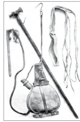
Emléktárgyak Vámbéry közép ázsiai utazásából: kamcsi, fokes, kosbág, tatár bőrkulacs

is. Az ő révén jutott el az akkori szellemi élet kiválóságaihoz: Vörösmarty Mihály hoz, „egy hosszúszerű pipából füstölő komor képű öregúrhoz” és Arany János hoz, akiről büszkén jegyezte fel: „szerette nyelvbeli tudásomat”.