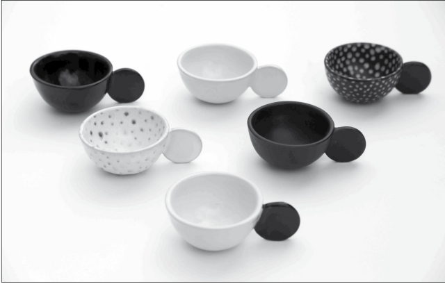
Kávészcészék, tervező: Anneli Sainio

nálható legyen. A kiállítás Finnország legélenjáróbb akadálymentes városépítészeti eredményeit köti csokorba és mutatja be a Műszaki Egyetem Urbanisztika Tanszékének folyosóin. Ez a vándorkiállítás 2012-ben jött létre a World Design Capital Helsinki 2012 programsorozat részére, s azóta járja Európát és mutatja be elsősorban a finn, de emellett az olasz és a francia várostervezők, akadálymentesítő szakemberek legfrissebb munkáinak eredményeit.