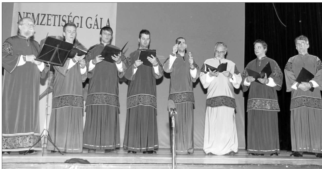
A Szent Efrém Bizánci Férfikar a Pro Cultura Minoritatum Hungariae díjátadó ünnepségén

A kórus érdeme, hogy a hazai ruszinok megismerhették az első ruszin nyelven írt egyházi énekeskönyvet, a Sajópálfalai Irmologiont, amely anyanyelvünk fejlődésének ékes példája. A Szent Efrém Bizánci Férfikar állandó résztvevője a hazai ruszin közösség rendezvényeinek. Hagyományosan a kórus kíséri a görög katolikus liturgiát, amely szerves része közösségünk ünnepeinek. 2012-ben kiemelkedő tevékenységüket a Pro Cultura Minoritatum Hungariae díjjal ismerték el.