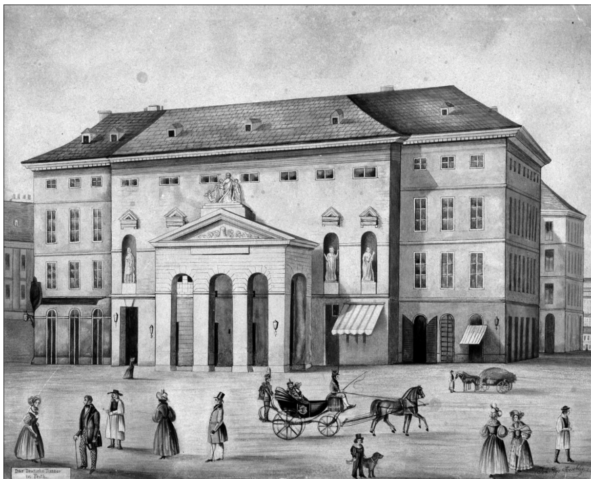
J. Muehling: A pesti Német Színház főhomlokzata

II. József közigazgatási reformjainak következményeként az ország központja Pozsonyból egyre inkább Budára került vissza. A kormány-székhelyé lett városban 1787-től a karmelita kolostor egykori templomában alakították ki a ma is álló Várszínházat, amelyet a Habsburg udvar és a kormányservek képviselőinek, valamint a tisztviselői karnak szántak. Pesten az egymás mellett élő nemzetiségek szintén megkezdték a maguk művelődési intézményeinek megteremtését. Manapság kevéssé köztudott, hogy akkoriban a német ajkú többség után másodikként a szerbek következtek és lélekszámában csak a harmadik helyet foglalták el a magyarok Pesten. A városban élő német polgárok előtt már a XVIII. század utolsó harmadától rendszeresen felléptek a germán nyelvterületről érkező hivatásos színtársulatok. Alkalmanként változó játszóhelyeiket 1774-től a középkori városfal bástyájában berendezett, ötszáz néző befogadására alkalmas Rondella színpada váltotta fel.