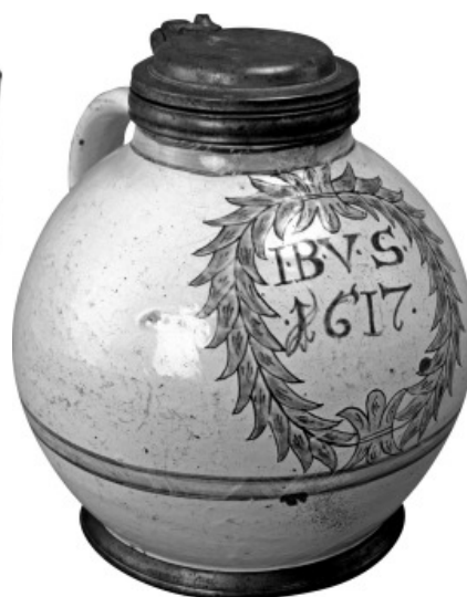
Őn kupakos korsó, I.B.V.S. monogrammal, 1617