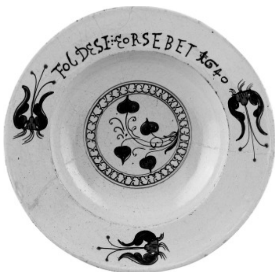
Tulipános díztányér „FOLDESI EORSEBET 1640” felirattal