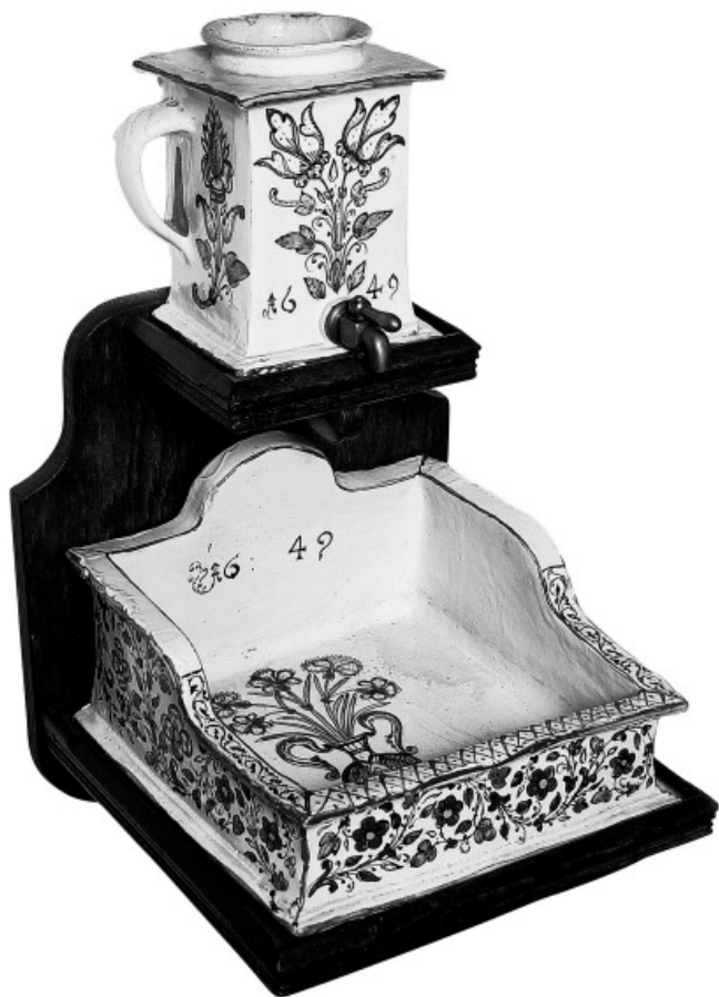
Víztartó edény medencével, pácolt fapolcon, 1649-es évszámmal

ideje alatt életbe léptetett törvények következtében az örökösökhöz kerültek. Ők ugyancsak hozzáférhetővé tették: jeles műtárgyaik a prágai Lobkowicz-palotában tekinthetők meg.