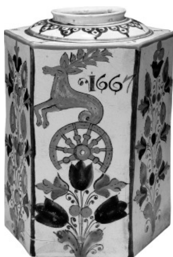
Hatszögletű palack a Pálffy-família címerével 1667-ből