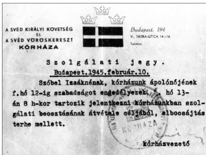
Egy véletlenül fennmaradt irat a kórházból

Tájékoztató Iroda a Jókai és a Táttra utcában is van (...)