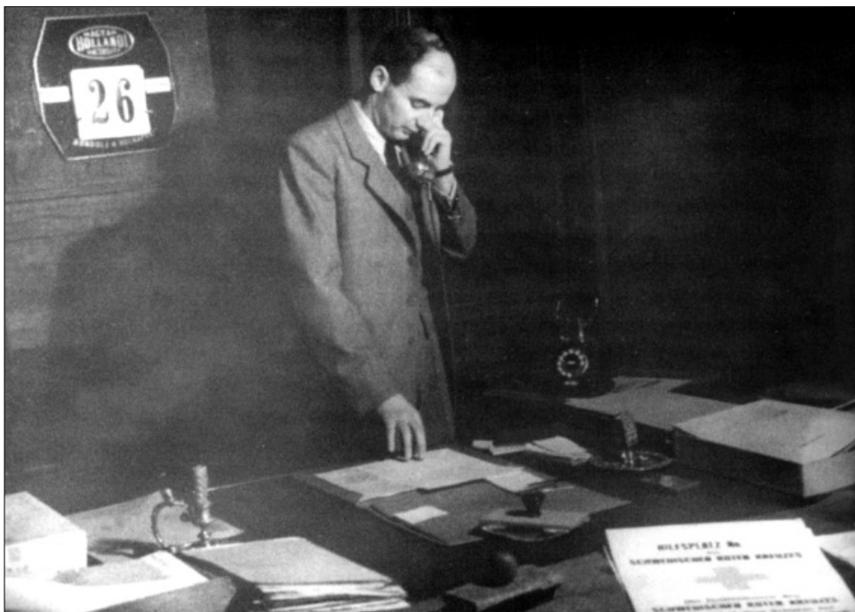
Raoul Wallenberg az Üllői úti irodában 1944. november 26-án

Wallenberg noteszeiben ezek a címek csak ritkán fordulnak elő. Augusztus 4-e, péntek este nyolc órára be van írva: „Minerva u. 1/A”. Október 24-én, kedden reggel hétre: „Gyopár-u”, nyolcra „Tigris”, utána megint „Gyopár-u”, másnap reggel fél kilencre „Tigris”. December 17-én, vasárnap déli egykor: „Üllői-út”, szerdán délután ötre ugyancsak. Telefonjegyzékében saját neve mellett három telefonszám áll, ezek megfejtése ma már lehetetlen.