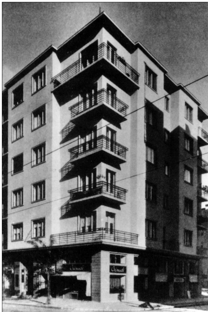
Az első svéd védett ház: Pozsonyi út 3.

A finn követség helyiségeiben 6 berendeztünk egy beszerzési részleget, amelynek a vezetését a zágrábi svéd konzul, Ekmark 7 látja el. A részleg eddig 300 000 pengőt és 300 pár cipőt kapott és használt fel.”