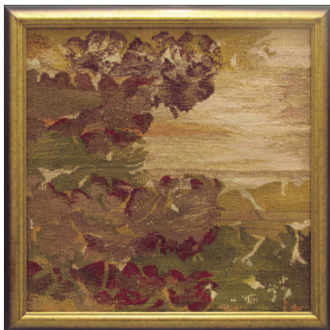
Maevszka Koncz Borjana: Virágos óceán 1