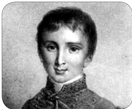
A 12 éves Liszt díszmagyarban