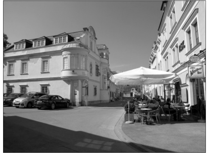
Autók, plakátok, zászlók – Burgenlandban 2011-ben minden Lisztről szól