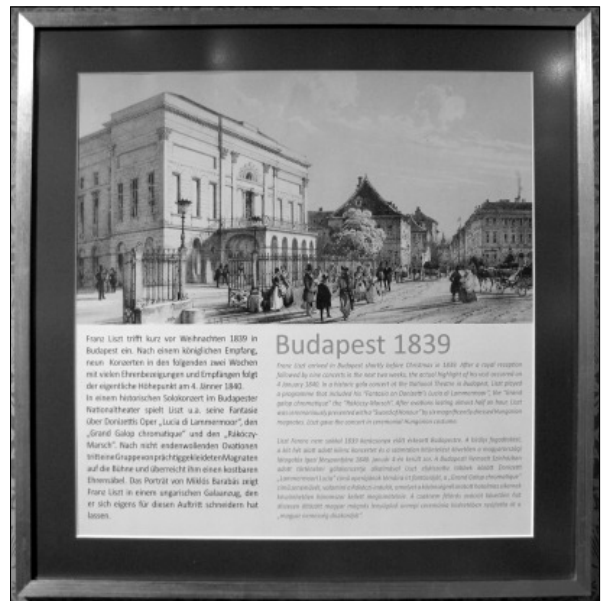
1839/40-ben járt koncertkörúton szerett hazájában