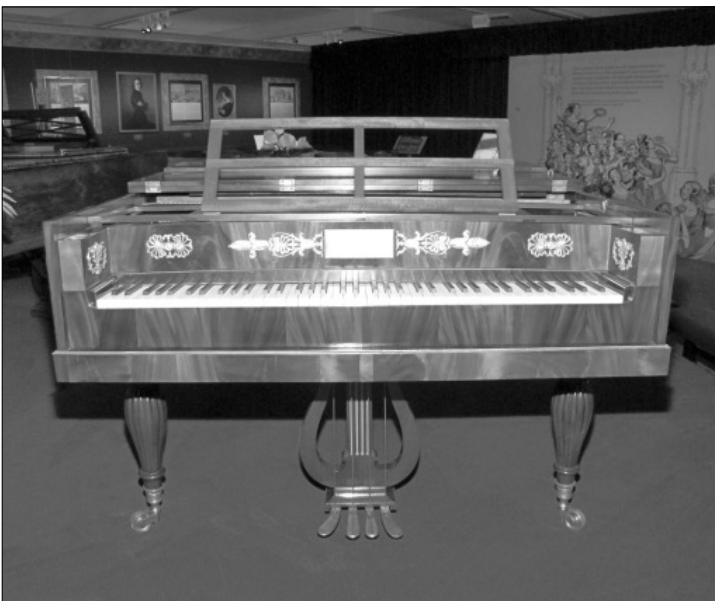
Erős felépítésű zongorát rendelt a szenvedélyes előadóművész a Roth műhelyből