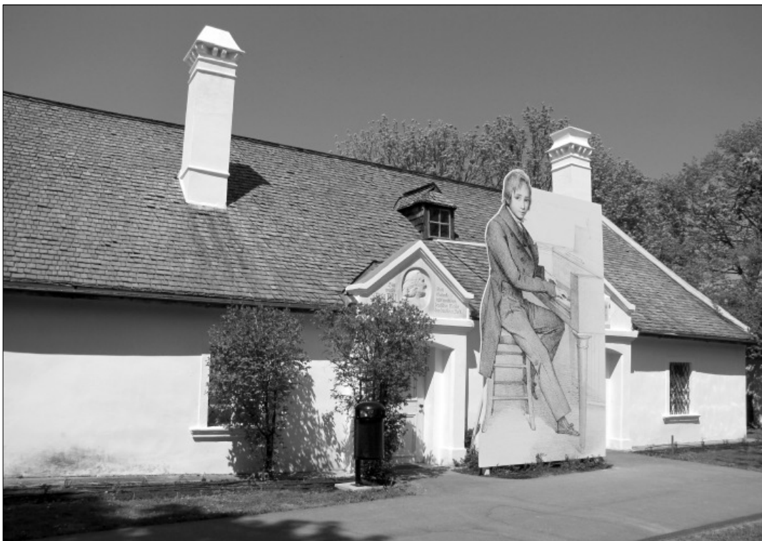
Liszt Ferenc szülőházában állandó kiállítás fogadja a látogatót. A fiatal Liszt kedvenc zongorája, és iskolapadja a kiállító teremben