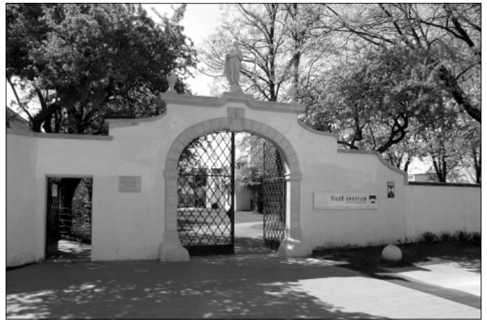
A Liszt-Központ bejárata Raiding/Doborján központjában, mely európai uniós forrásból készült. 1969 óta a Liszt Egyesület ápolja a zeneszerző emlékét