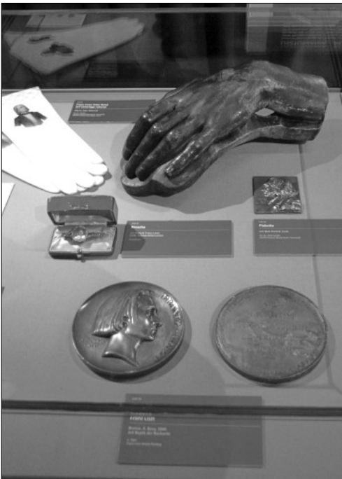
Bronzba öntött keze az elmaradhatatlan kesztyűvel