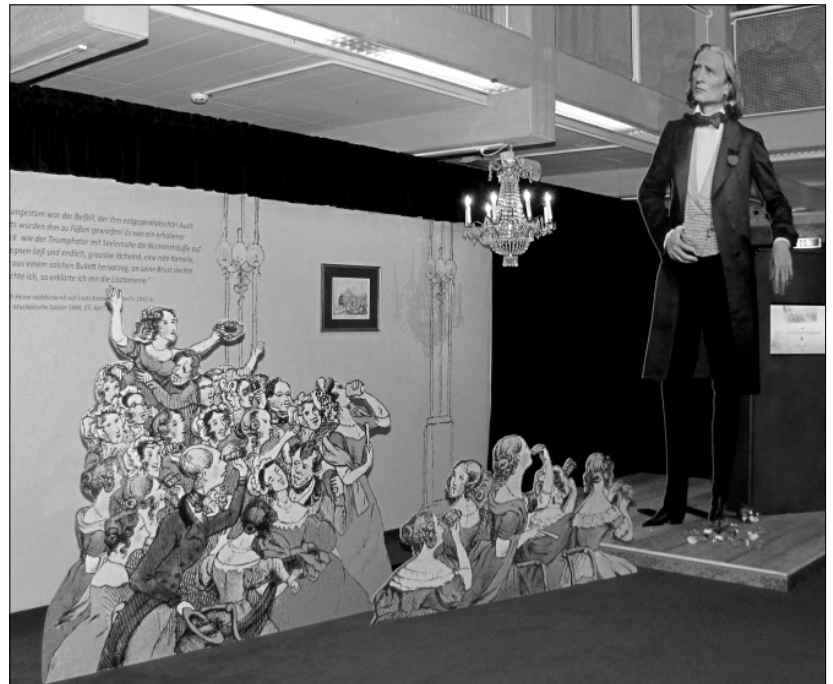
Lisztomania 2011 kiállítás Burgenland Tartományi Múzeumában