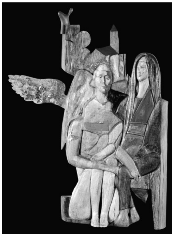
Nagy Gábor: Angyali üdvözlés (2010), festett fa