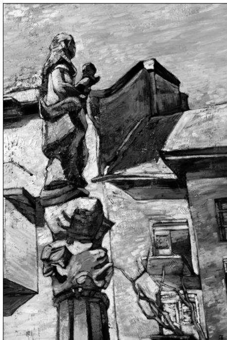
Papageorgiu Andrea: Délelőtti ragyogás (2010), olaj, farost