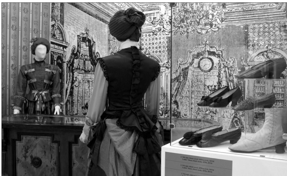
Korabeli cipőbolt rekonstrukciója a tárlaton eladóval és vásárlóval

csillagai” – Kossuth Lajosné, gróf Károlyi Györgyné, gróf Batthyány Lajosné és a Zichy grófkisasszonyok –, valamint férfi partnereik is magyar kelméből, magyar szabók által készített öltözeteket viselnek.