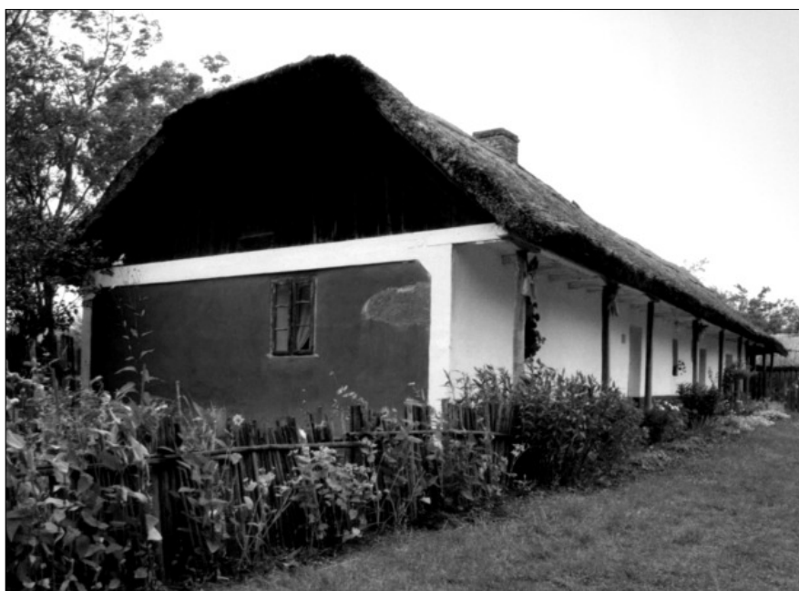
Nyíregyháza, Sóstói Múzeumfalu: Tírpák porta