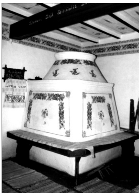
Tótkomlós: Szlovák Tájház