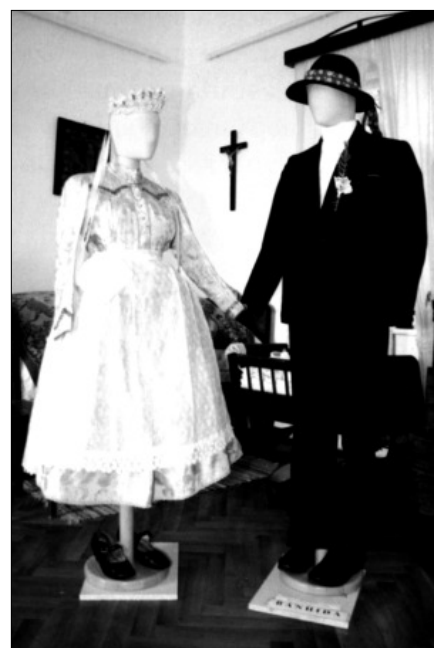
Tatabánya-Bánhida: Szlovák Ház