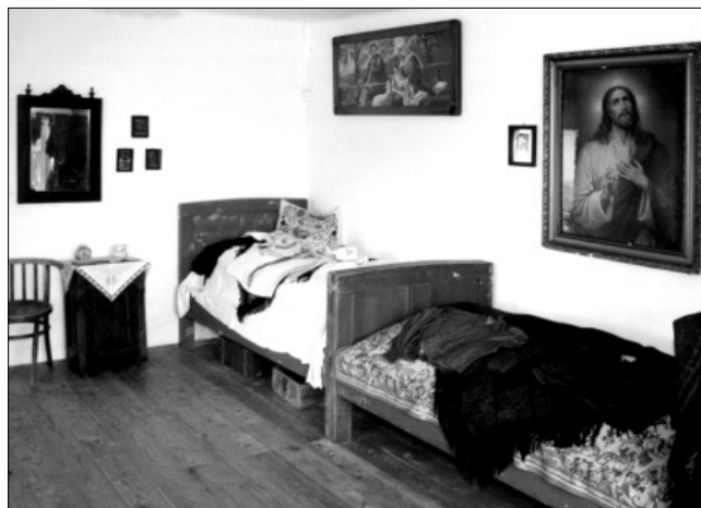
Pilisszentkereszt: Szlovák Tájház

2009-ben kiadásában jelent meg az a reprezentatív album, mely Magyarország szlovák tájházait, múzeumait, gyűjteményeit mutatja be gazdag kép- anyaggal illusztrálva.