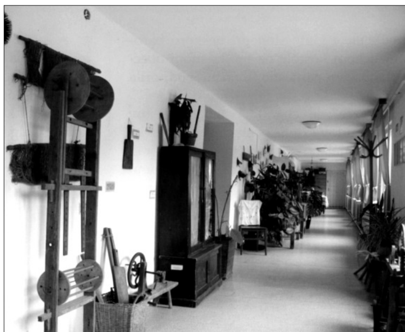
Galgaguta: Tájfolyosó az általános iskolában