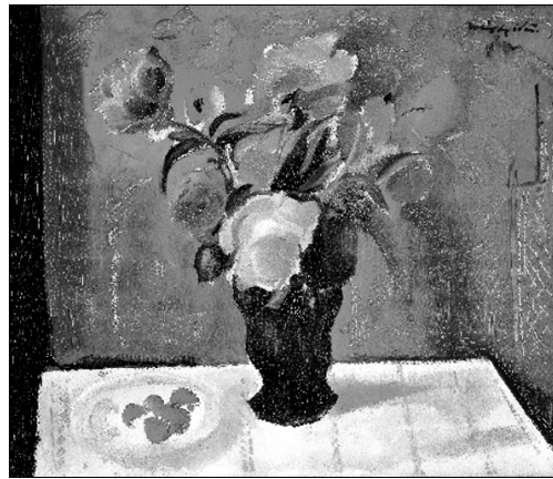
Márffy Ödön: Vörös virágcsendélet (1929, olaj, vászon)