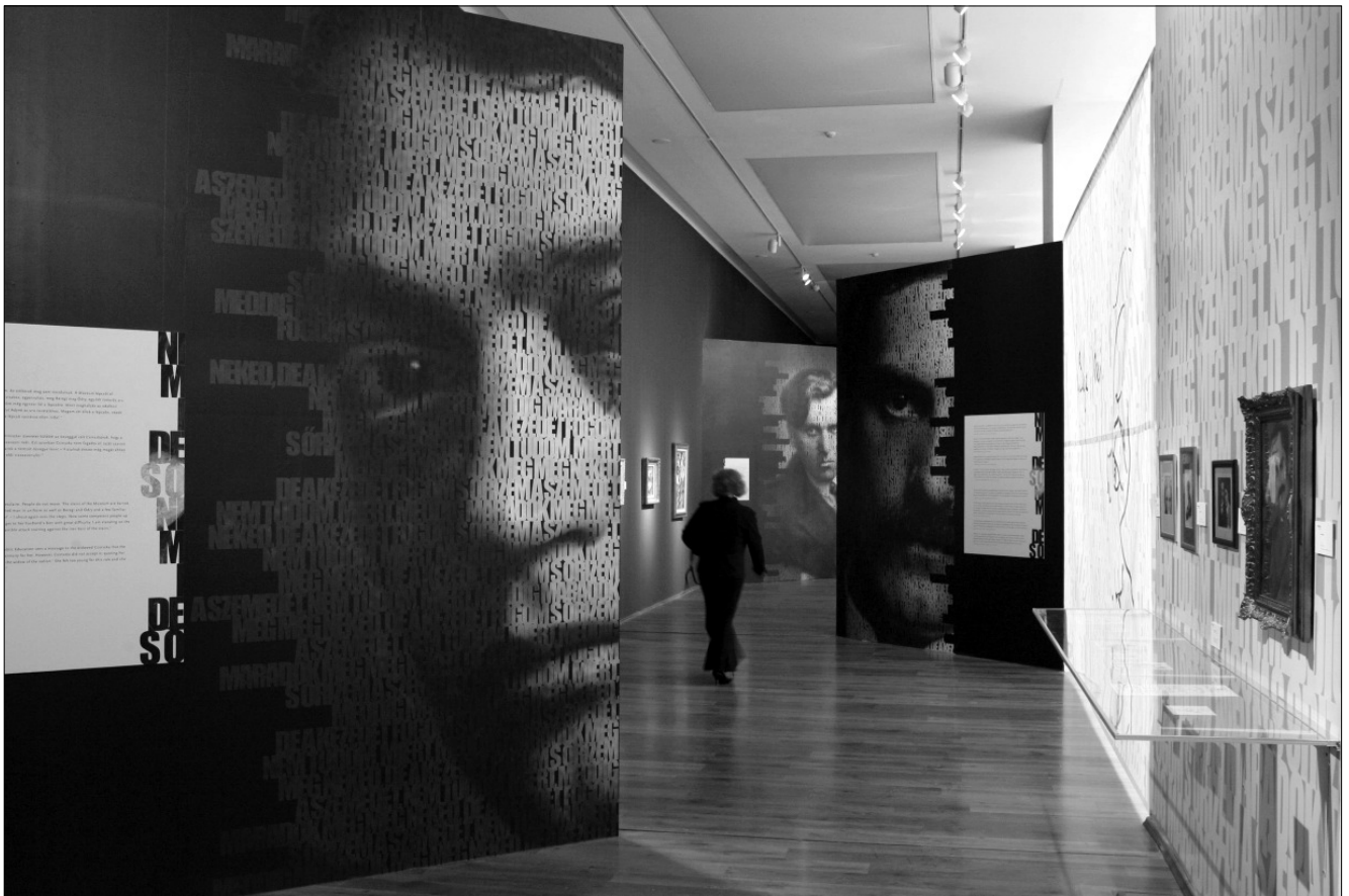
Debreceni tárlat-részlet Ady, Babits és Márffy óriás-fotóival