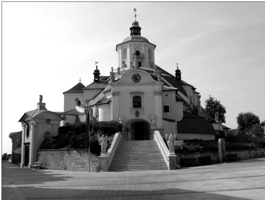
A kismartoni (Eisenstadt-i) Bergkirche búcsújáróhely, oldalában található a Haydn-templom. Itt van Haydn eltemetve.

Haydn, ahogy korábban, ma sem hagyja kisajátítani magát. Személye fontos kulturális összekötőkapocs Ausztria és Magyarország közt, zenéje pedig az emberiség egyetemes világkincse. A lassan végéhez érő – s zenei nagyságához méltó – emlékévknek mindenképp ez a legfőbb tanulsága.