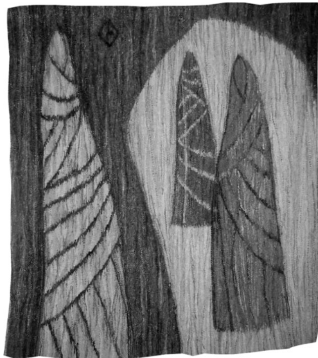
Kelet I. (1980), kecskeszőr és pamut

mas kompozíció nemcsak a tárlaton tölti be az egész falat. A katalógusban is három kinyitható lapon reprodukálták, hogy összetettségét érzékeltessék.