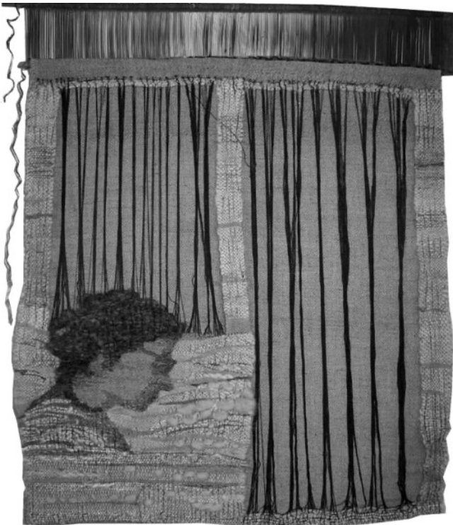
Szövőnő (önarckép, 1977), gyapjú és gyapot