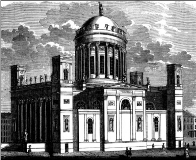
A Bazilika, korabeli nevén a „Pesti Lipót-egyház”, és a Mátyás templom a budai várban; Barnaföldi Gábor archív felvételei alapján

suk le asztalunkról a tejet, jó levest, kávét, theát, csokoládét, a különemű husétkeket, halat (kivéve a füstölt és túlkövéreket), tésztaféléket, leveles konyhazöldséget, az érett és édes, de kivált főzött gyümölcsöt.