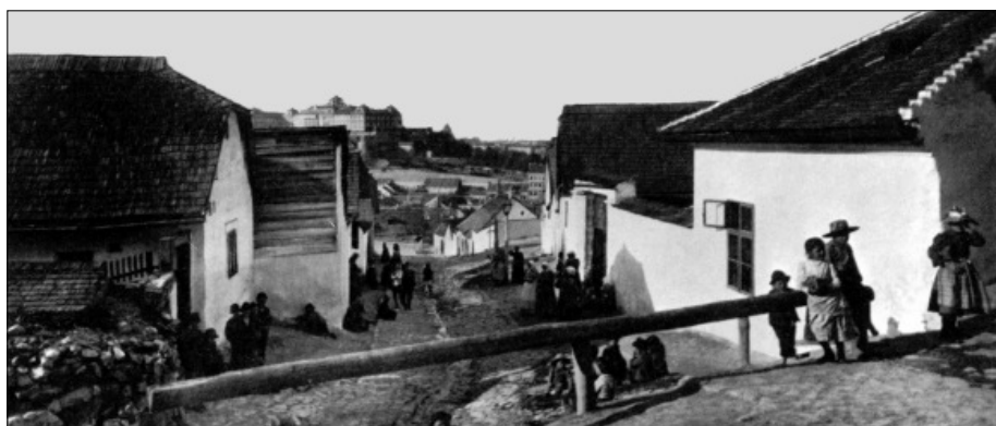
A Tabán 1890 körül

Köszönet a Budapest Történeti Múzeumnak, amiért támogatták munkámat! www.btm.hu