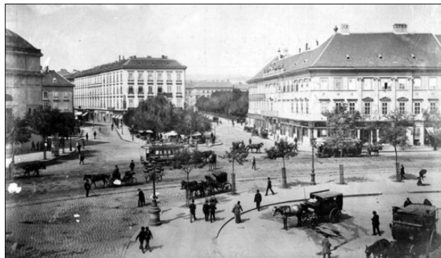
A budapesti Deák tér 1890 körül (fent), és a Blaha Lujza tér 1910 körül