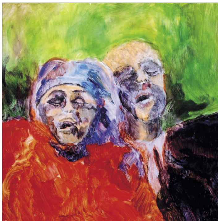
Kimerülten 2005, HTT, acél 100x100 cm