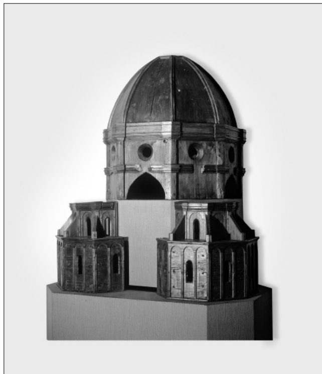
Filippo Brunelleschinek tulajdonítva: A firenzei dóm kupolájának és szentélyének famodellje