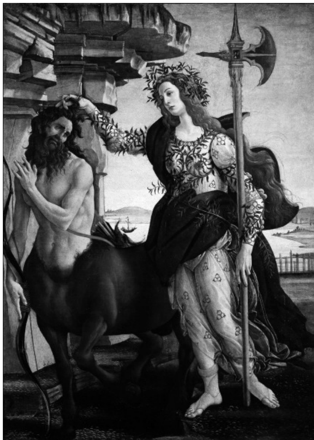
Sandro Botticelli: Pallasz Athéné és a kentaur (1482 körül), olaj-vászon