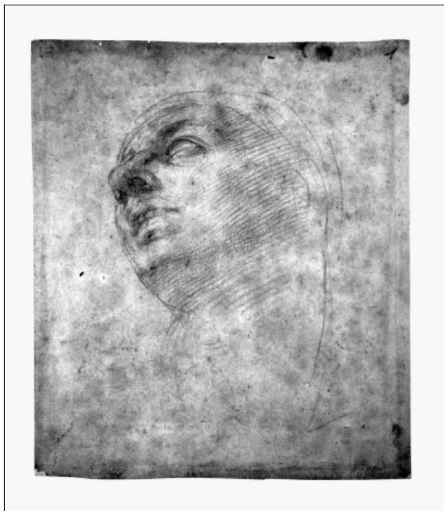
Michelangelo Buonarroti: Tanulmányfej a Doni-tondóhoz (1504 ?), vörös kréta