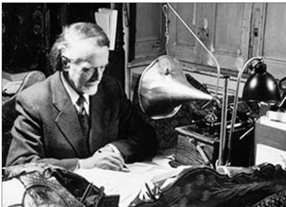
Munka közben a fonográfjal

Műveit idehaza, de külföldön is egyre többször játszották. I. vonósnyegyest és Gordonka-zongora-szonátáját 1910-ben Zürichben, 1912-ben Párizsban, 1913-ban Londonban, 1915-ben öt amerikai városban is sikerrel mutatták be. Zeneelméleti és zenekritikai ismeretterjesztést is folytatott: a Nyugatban, az Ethnographiában , a Zenei Szemlében és a Pesti Naplóban publikált.