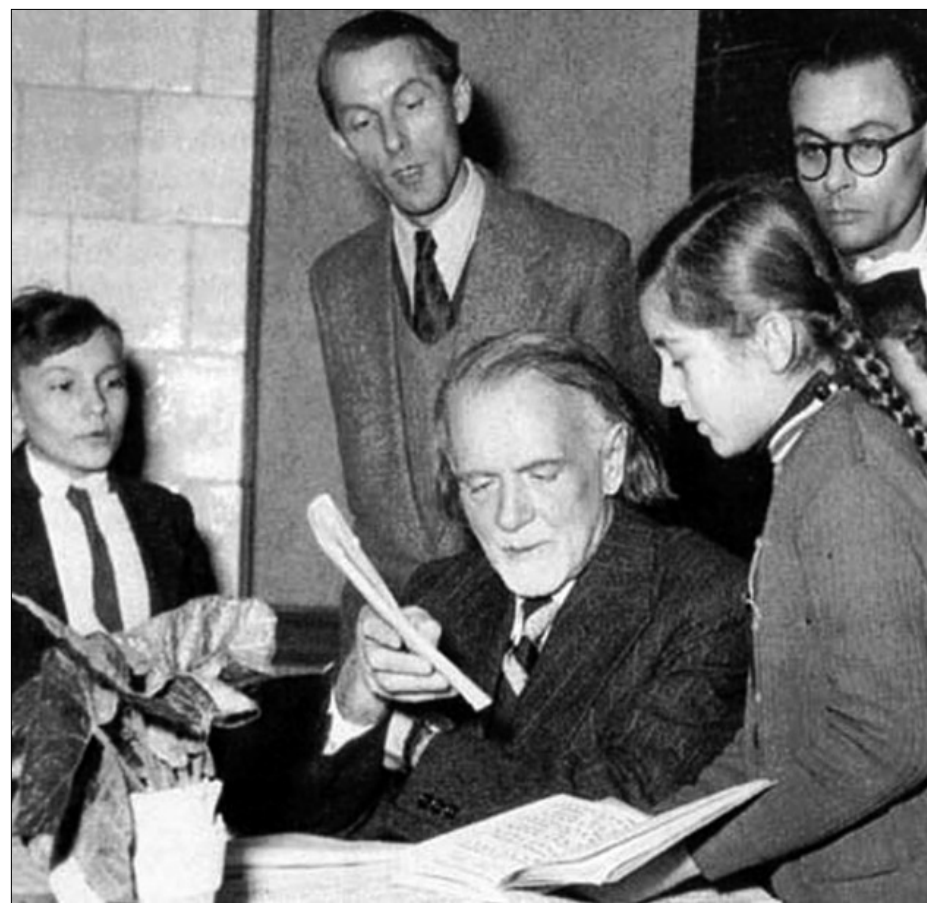
Tanítványai és barátai körében

A Magyar Életrajzi Lexikon Kodályról szóló cikke nem fukarkodik az elismeréssel: „külön ki kell emelni kórusművészetét, amely a XX. századi zene történetében egyedülálló, korszakos jelentőségű. A reneszánsz vokálpolyfónia mesterei óta nem volt zeneszerző, aki hasonló súlylyal és színvonalon kezelte volna az énekkart. Fáradozásai a magyar zenei műveltség felvirágoztatásáért felmérhetetlen értékűek. Sikraszállt az iskolai énekoktatás megújításáért, pedagógiai jellegű műveivel és írásaival egy műveltebb, tartalmasabb muzsikugeneráció felnevelésén munkálkodott, fáradhatatlanul küzdött a helyes magyar nyelv és általában a nemzeti tradíciók megőrzéséért. Mint tudós módszeresen gyűjtötte, feldolgozta és rendszerezte a magyar népdalokat és a népi zenekultúra egyéb elemeit, tudományos tevékenységével az összehasonlító népzene-tudomány nemzetközileg elismert, úttörő jelentőségű képviselője lett”.