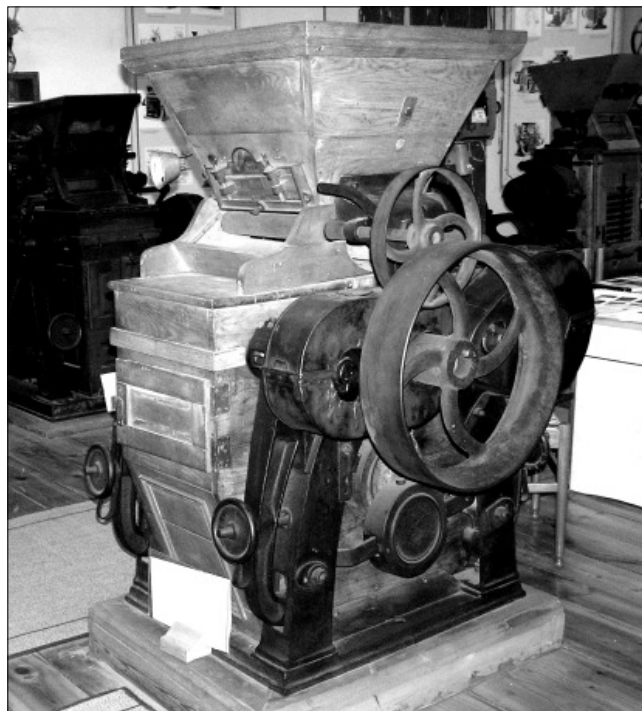
Ganz-Wegmann-féle hengersizék, 1876-ból (Malomipari Múzeum)

1878-ban Budán, a Kacska utcában a Ganz villamos részleget alakított ki, ami egyúttal az első ilyen jellegű vállalkozás volt a Monarchia területén. Mechwart olyan embereket nyert meg az ügynek, mint Zipernowsky Károly, később pedig Déri Miksa és Bláthy Ottó. Minden kezdet nehéz, tartja a mondás. Mechwartnak rengeteget kellett csatároznia a Ganz igazgatósági ülésein ahhoz, hogy ne zárják be az akkor még veszteséges kis műhelyt. Talán még ő maga sem sejtette, hogy az az aprócska üzem a földrész legnagyobb villamossági gyárává növi ki magát, pedig így történt, Mechwart kitarását siker koronázta. Zipernowsky vezetésével előállították az első váltakozó áramú dinamót, majd 1882-ben, amikor már Déri és Bláthy is a cég alkalmazásában álltak – London és Brünn után – a világon harmadikként megoldották egy épület, nálunk jelesen a Nemzeti Színház villamos világítását! 1883-ban a Bécsi Elektromos Szakkiállításán a Ganz gyári munkája nyomán fűródhetett a Keleti Pavilon fényárban. 1884 az üzem történetének újabb fontos dátuma: