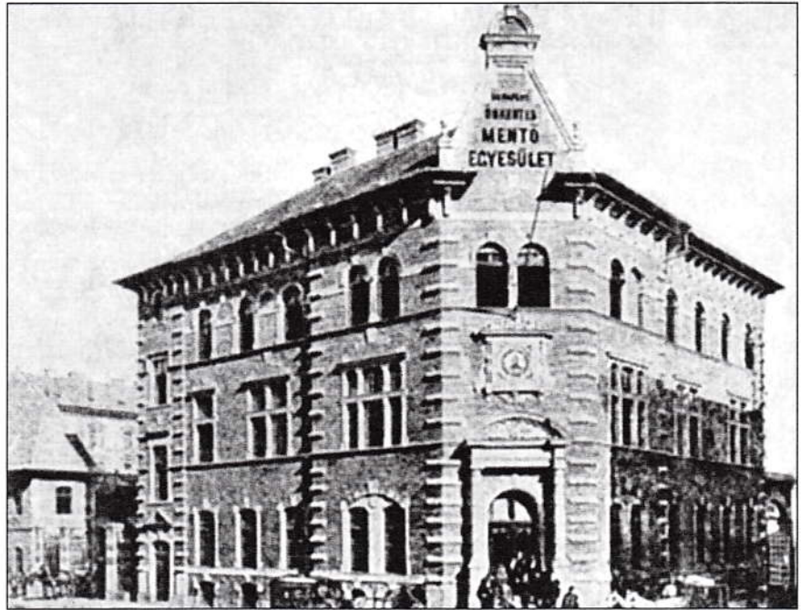
Az 1889–90-ben épített mentőállomás Pesten, a Markó utcában

Mentőegyletek külföldön már jó ideje léteztek, s 1880-ban Pesten is megindult a szervezkedés – ám az egyesületalapítást célzó értekezletek csakhamar abba is maradtak. Az 1881-es londoni mentőkiállítás tapasztalatai újra a közérdeklődés rivaldafényébe állították a mentést: A döntő lökést azonban a bécsi Ring Színház több száz halálos áldozatot követelő égése és a bécsi mentők ezt követő megalapítása adta meg: oly sok más ügyszóhoz hasonlóan most is a társfőváros iránt érzett irigység kerekedett felül a fővárosiak – mindezekelőtt takarékoságból fakadó – konzervativizmu-