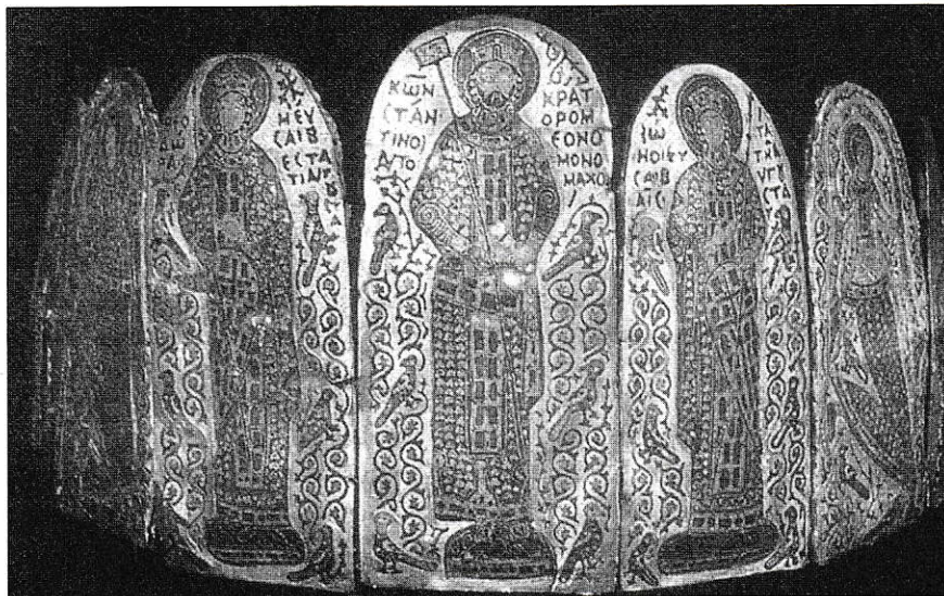
Monomachos koronája a szlovákiai Nyitraivánfároról