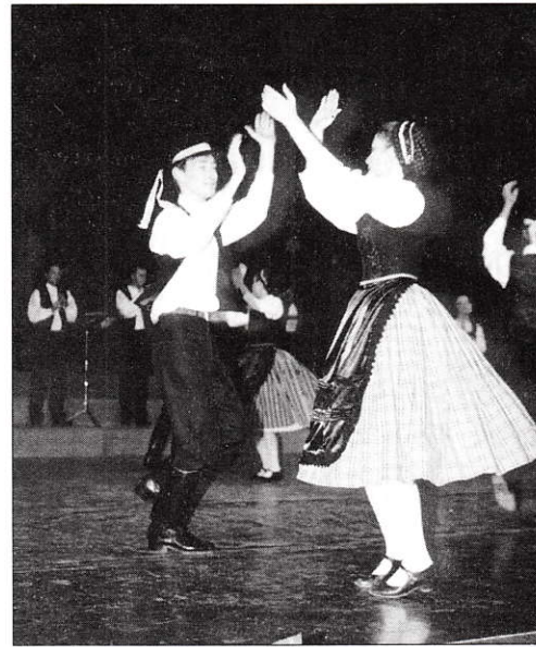
A pécsi Leówey Táncegyüttes