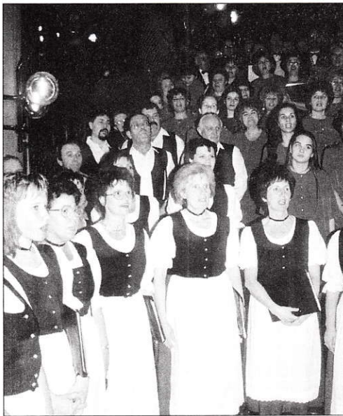
A Bóly-Mohácsi Vegyeskar