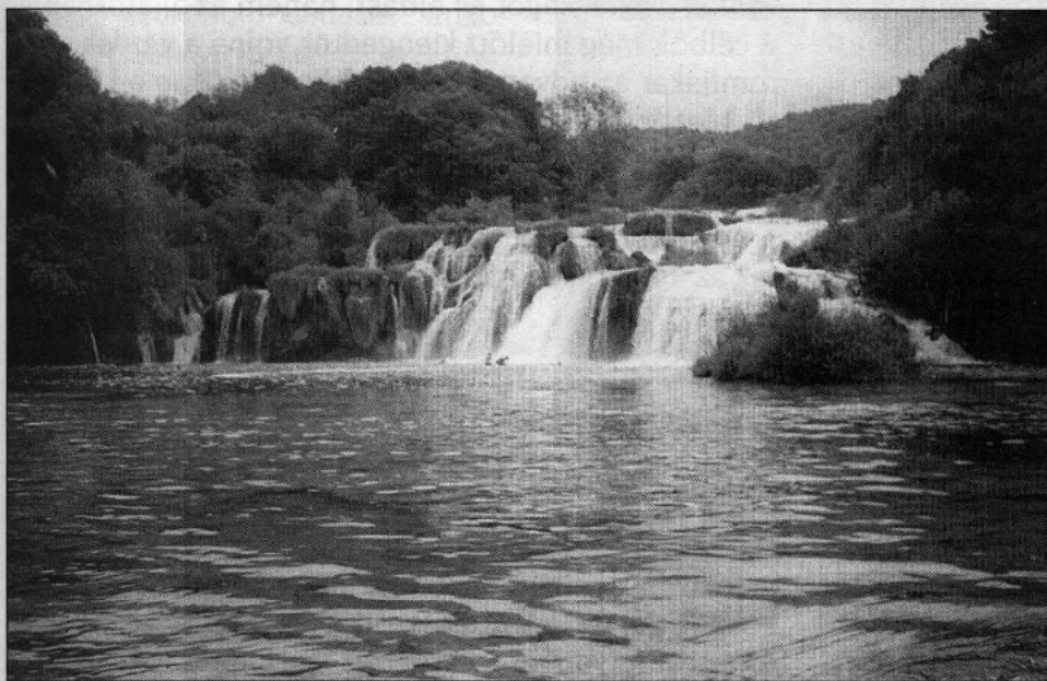
A dalmát hátság ( Dalmatinska Zagora ) és Horvátország egyik legszebb látványossága: a Krka folyó vízesései.