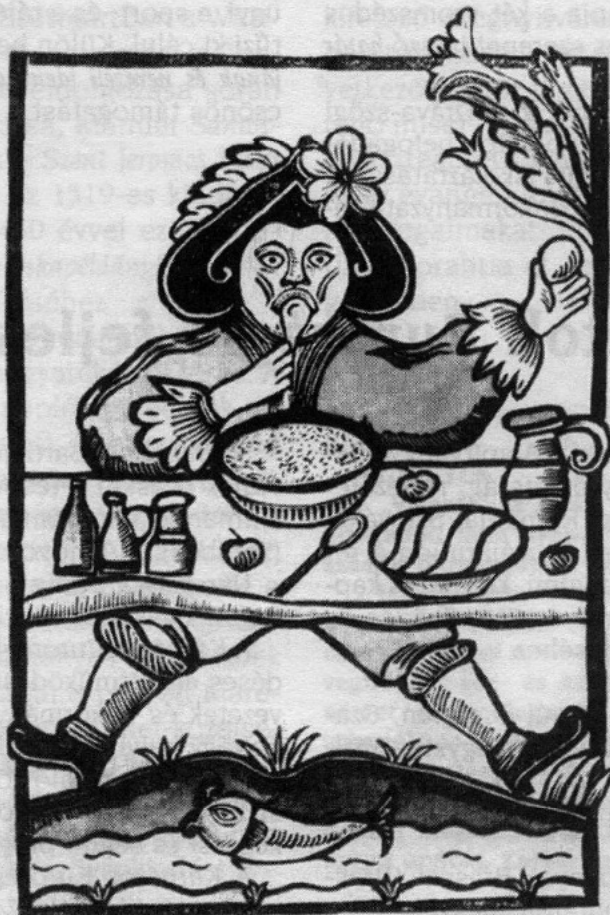
Keresztesi Dóra: Magyar népmese-illusztráció