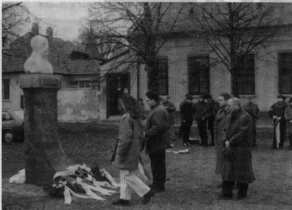
Gyulai szervezetek és polgárok megkoszorúzták városuk szülöttének szobrát